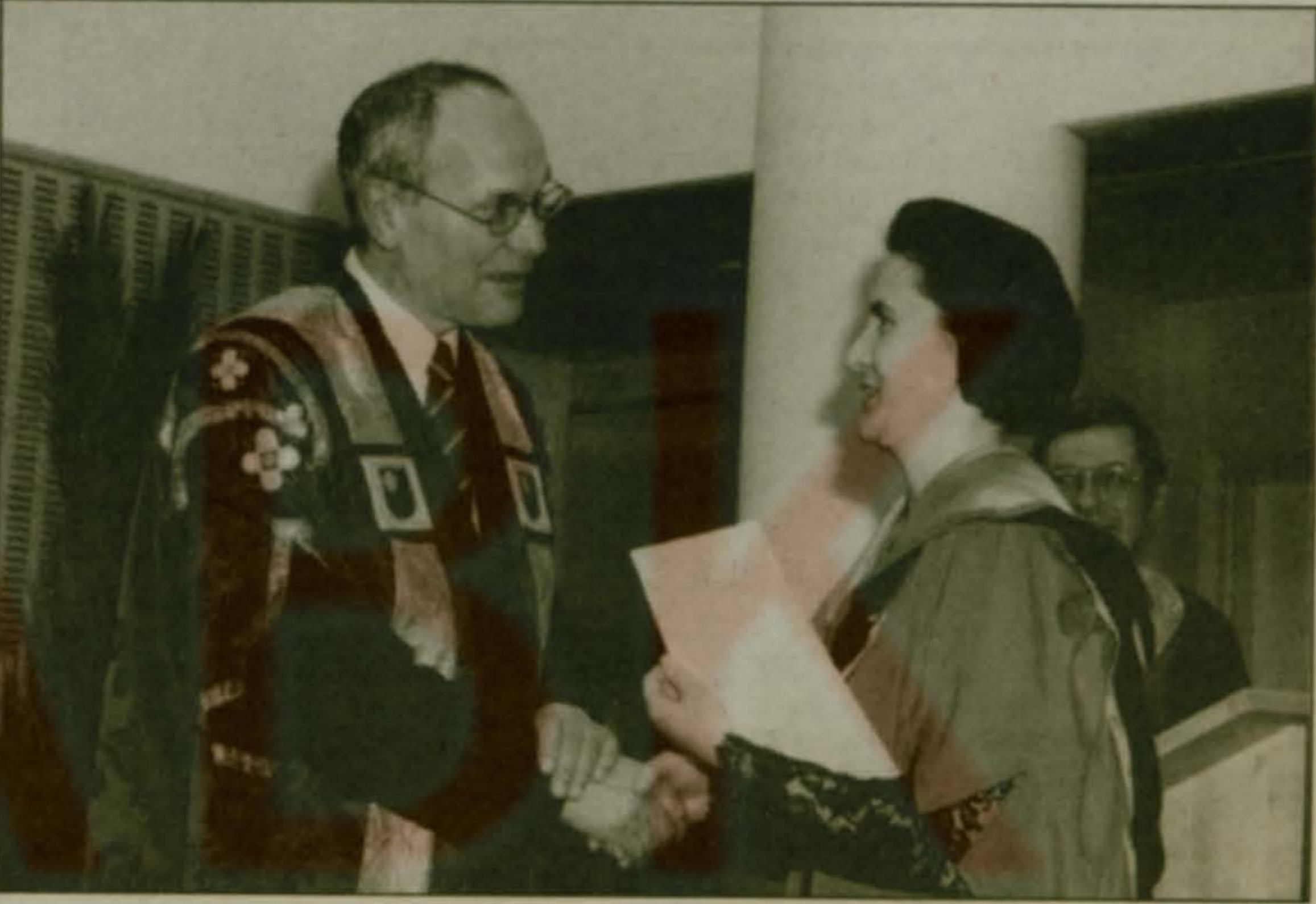
Про-Вицекандлер Открытого Университета Джозеф Питерс вручает дипломы MBA выпускникам.