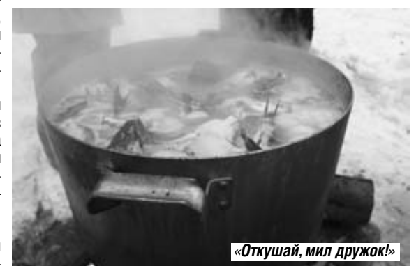
«Откушай, мил дружок!»