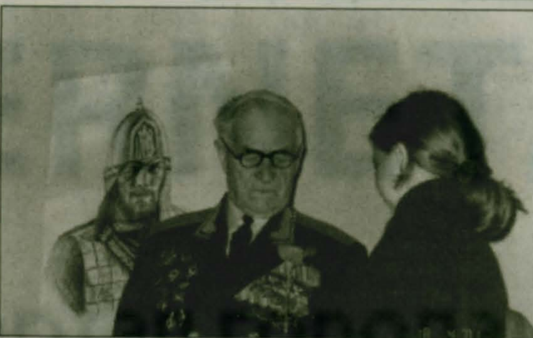
Герой России генерал-майор С.В. Григоренко.

Ждем вас на прием в бюро технической инвентаризации в понедельник и четверг с 9-00 до 18-00, обед с 13-00 до 14-00, специальный день по вопросам приватизации - среда, с 9-30 до 13-00. Мы проконсультируем и окажем помощь в изготовлении технических документов на строения и прилегающие земельные участки.