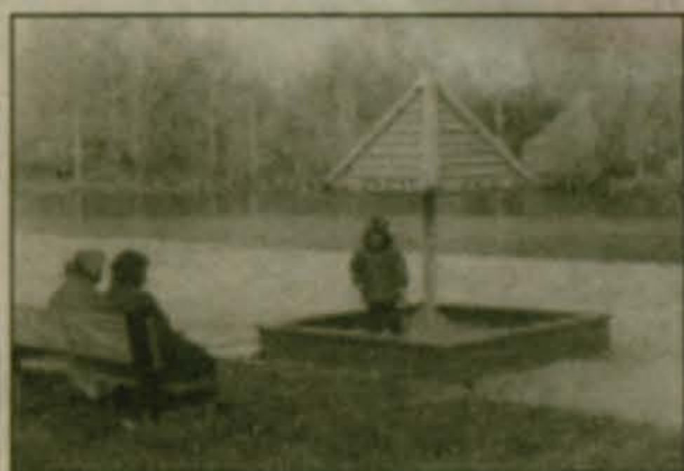
► Натасинские пруды прошлой осенью

Изуродовано излюбленное место отдыха люберчан - Натасинские пруды. Незвестные "грибники" аккуратно спилили шляпки грибов детских песочниц. Жители воз-