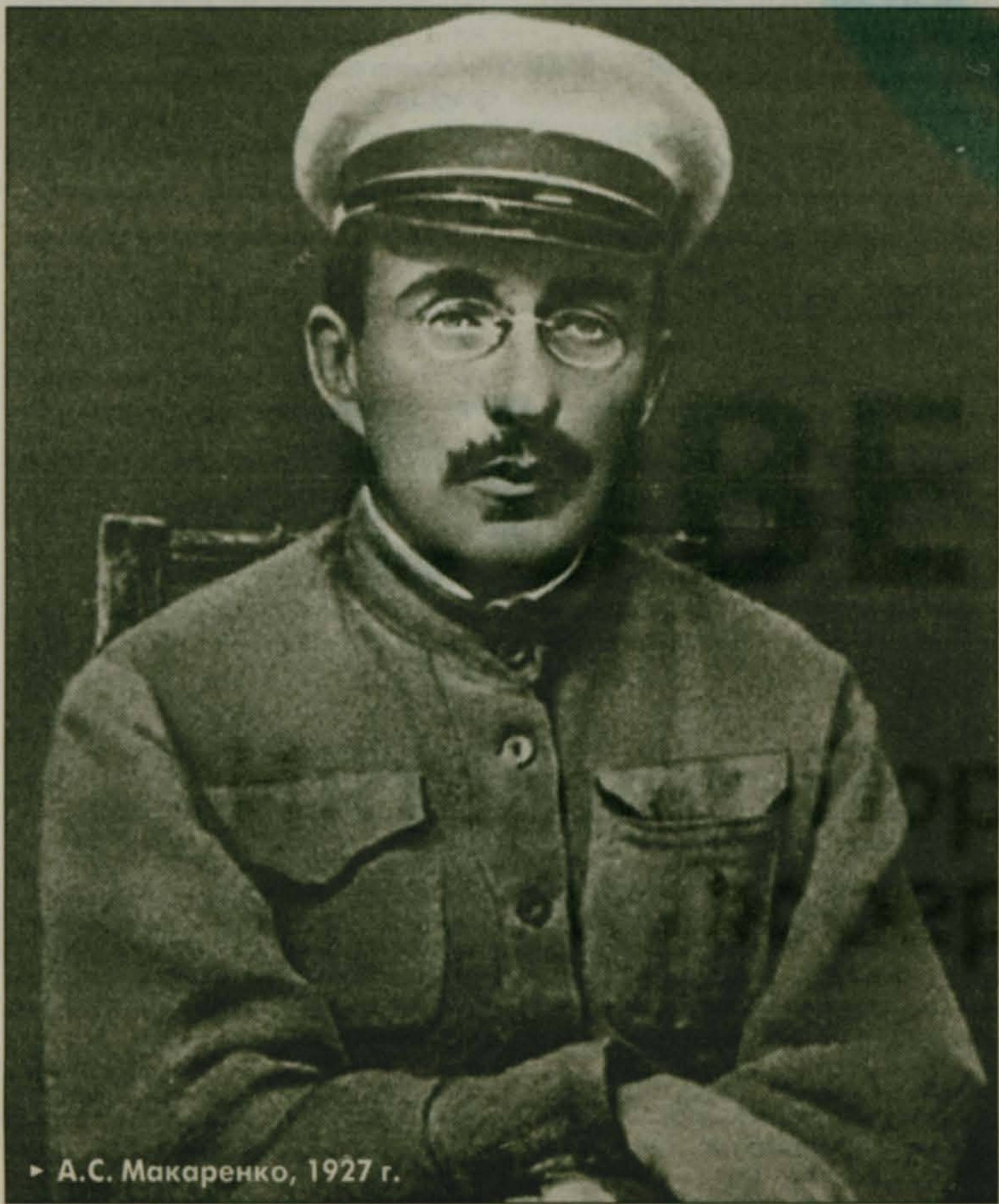
▶ А.С. Макаренко, 1927 г.