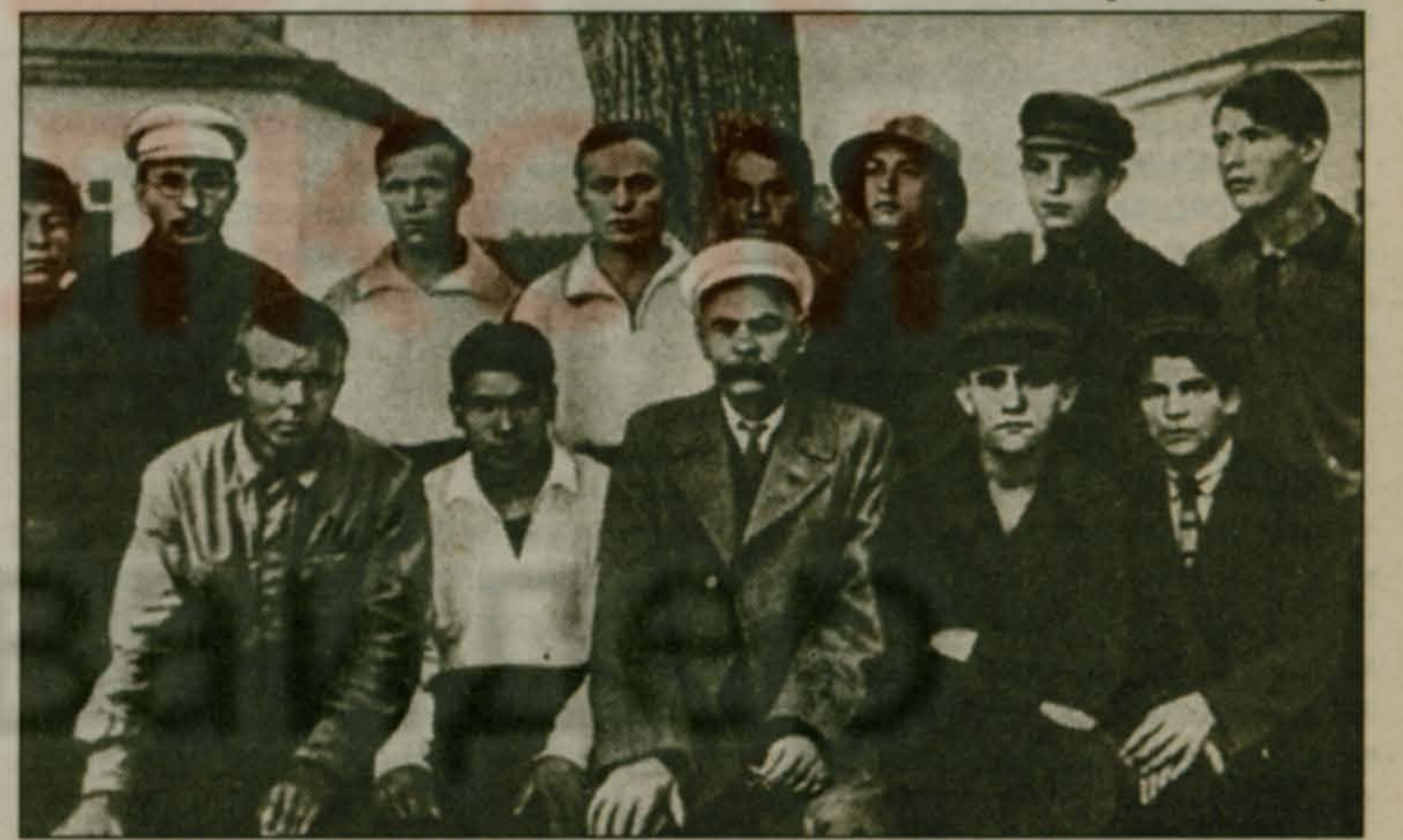
▶ М. Горький и А. Макаренко среди колонистов-рабфаковцев, 1928 г.