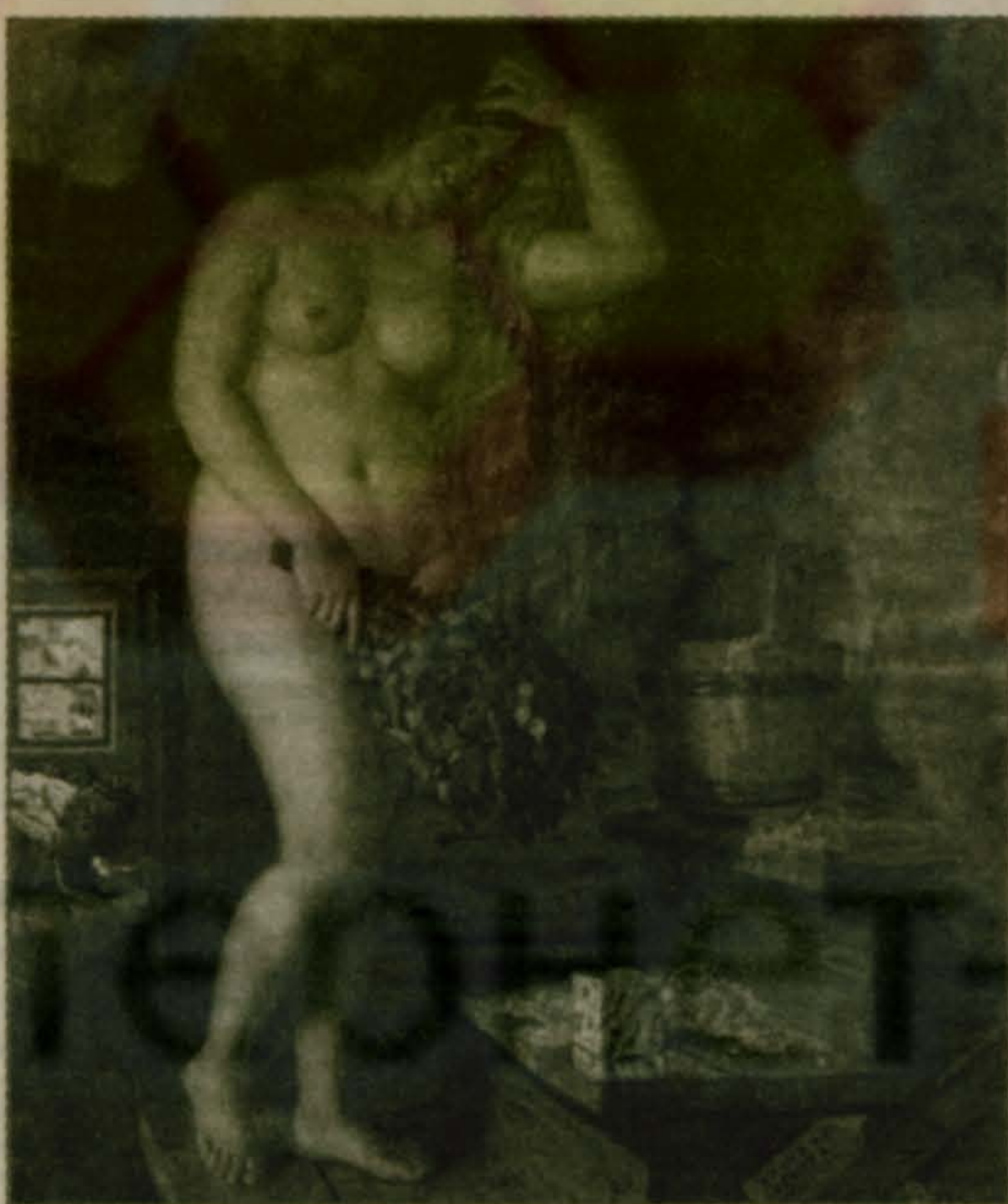
Б. Кустодиев. Русская Венера. 1925-1926 гг.