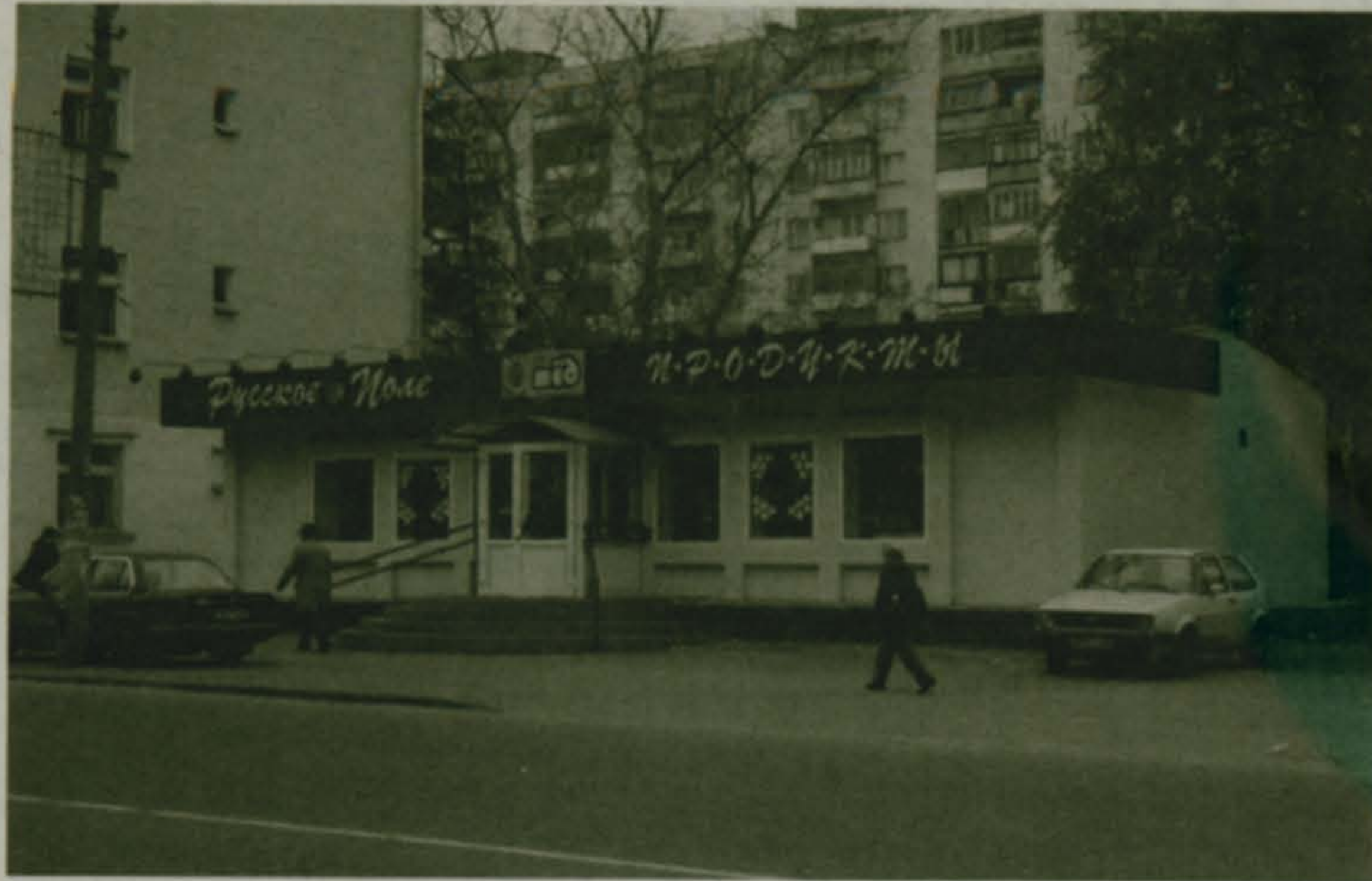
Окончание. Начало на стр. 3

А вообще у нас в милиции работают две специализированные экономические структуры - ОБЭП и наш отдел. И в отношении проверок мы подчиняемся не губернаторскому документу, а Закону "О милиции", который вовсе не определяет количество проверок, а рекомендует действовать "на основании конкретной информации о правонарушениях" (это, кстати, фраза из губернаторского распоряжения), а такая информация приходит к нам ежедневно.