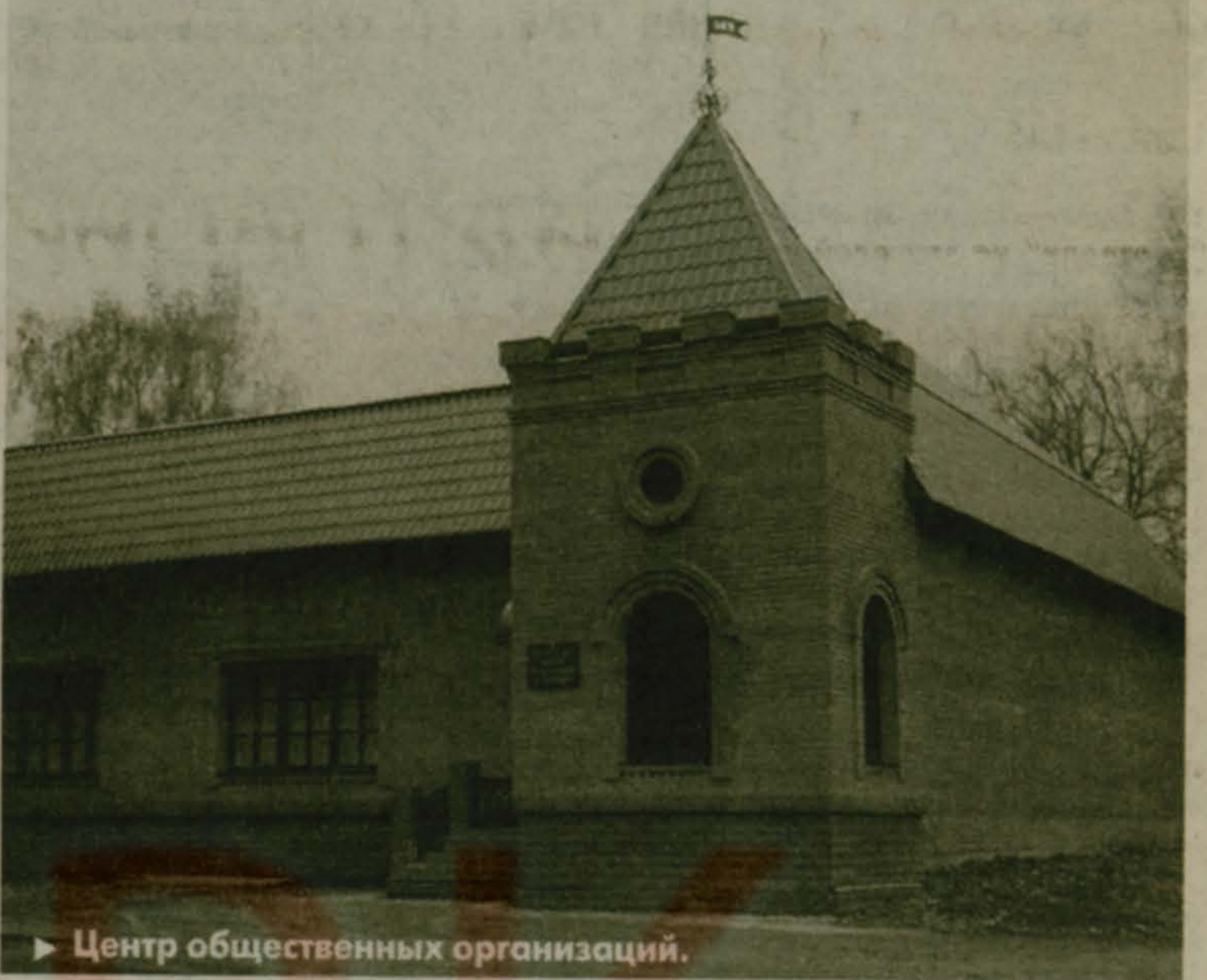
▶ Центр общественных организаций.

- Конечно, в Малаховке много особенностей. На тему о материальном благополучии: я бы обратила внимание на тех, кто не "прячется за высокими заборами", как сказано в письме, а наоборот - готовы помочь и выслушать любого. А недовольным я бы сказала так: всем не угодить - это закон. Поэтому к подобной критике я всегда