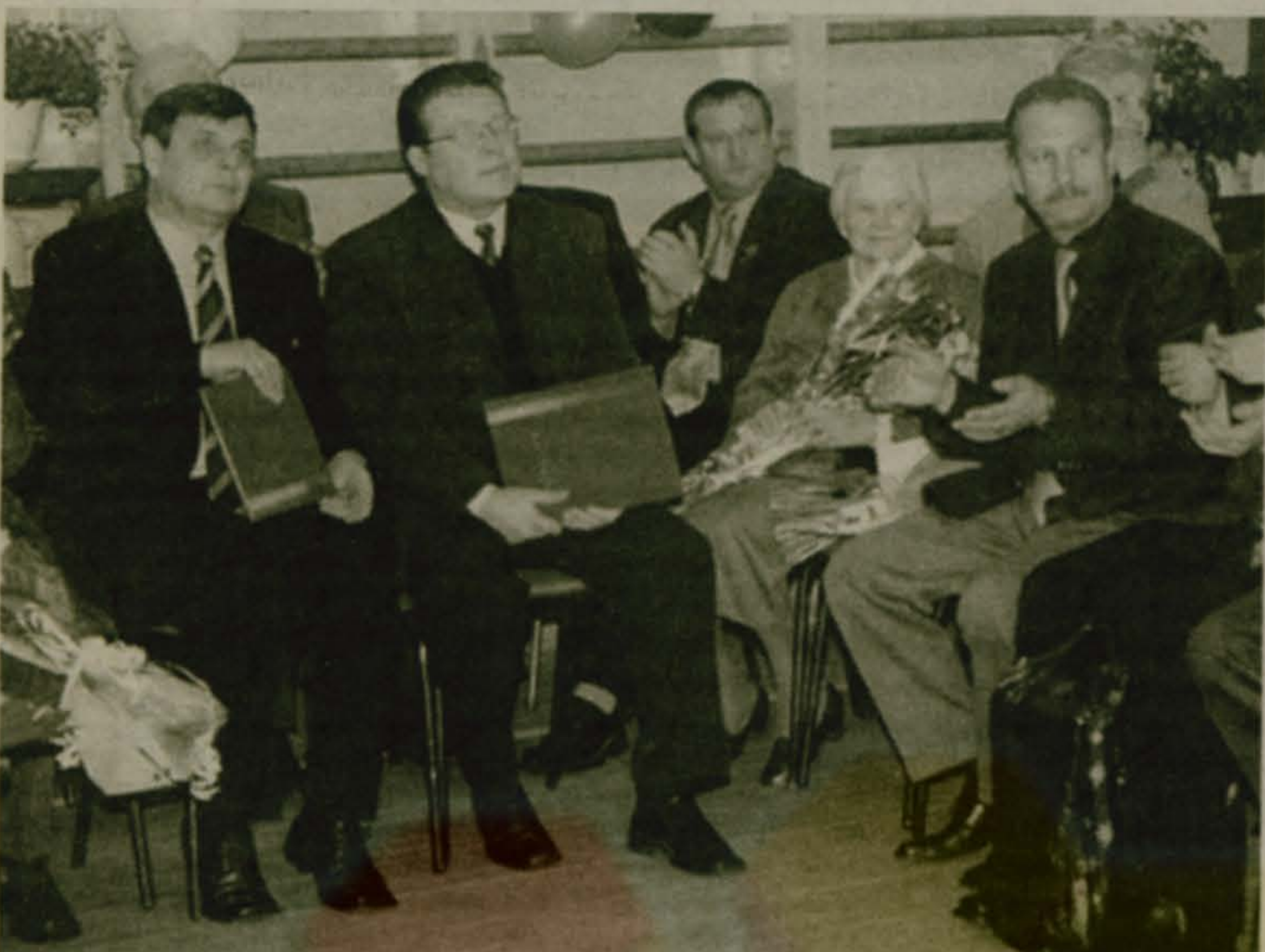
Палисадник с низким частоколом, двухэтажный серый длинный дом, Sportплощадка перед входом - Школа! Предстает в сознании моем...