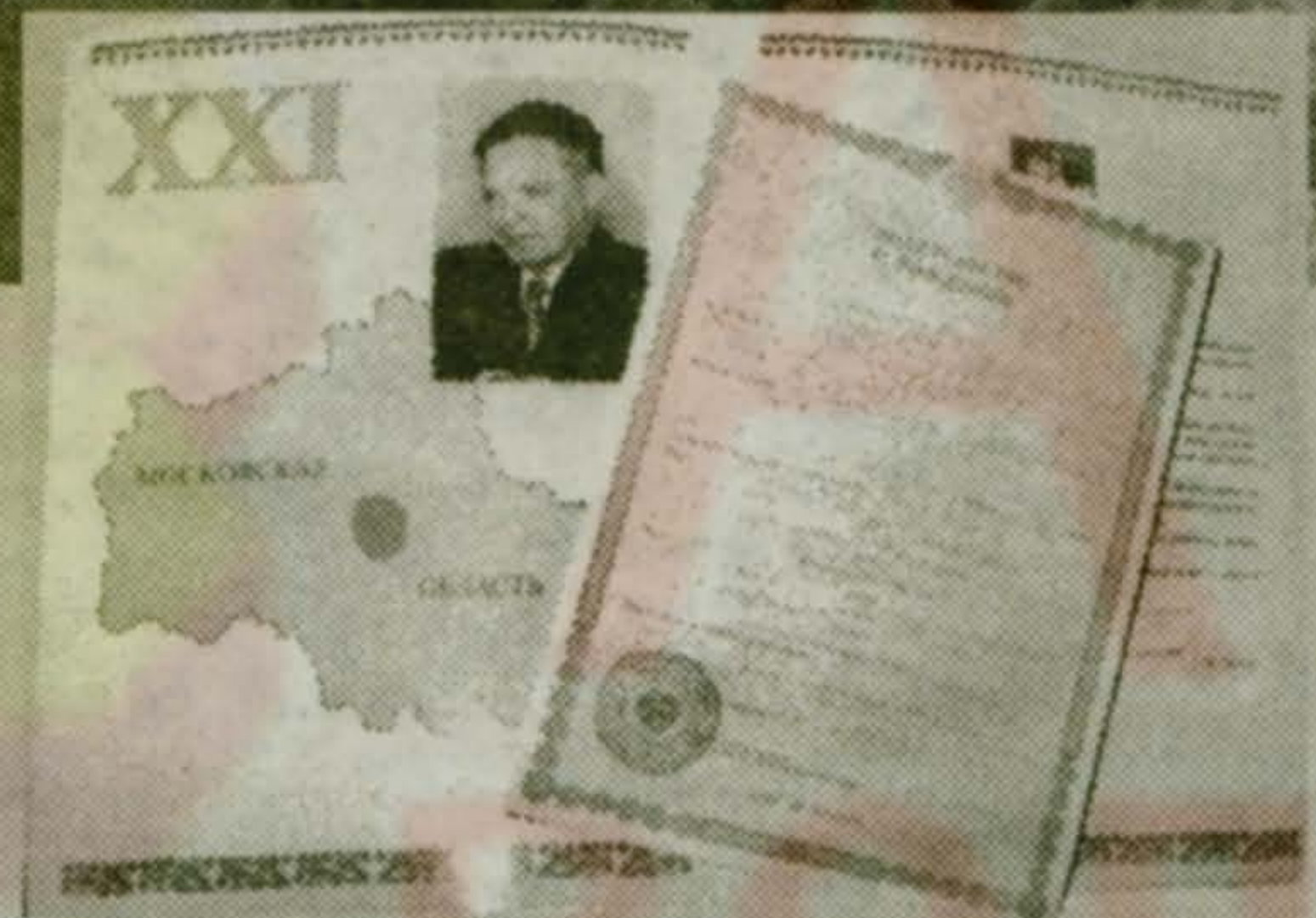
Фоторепортаж – на стр. 3