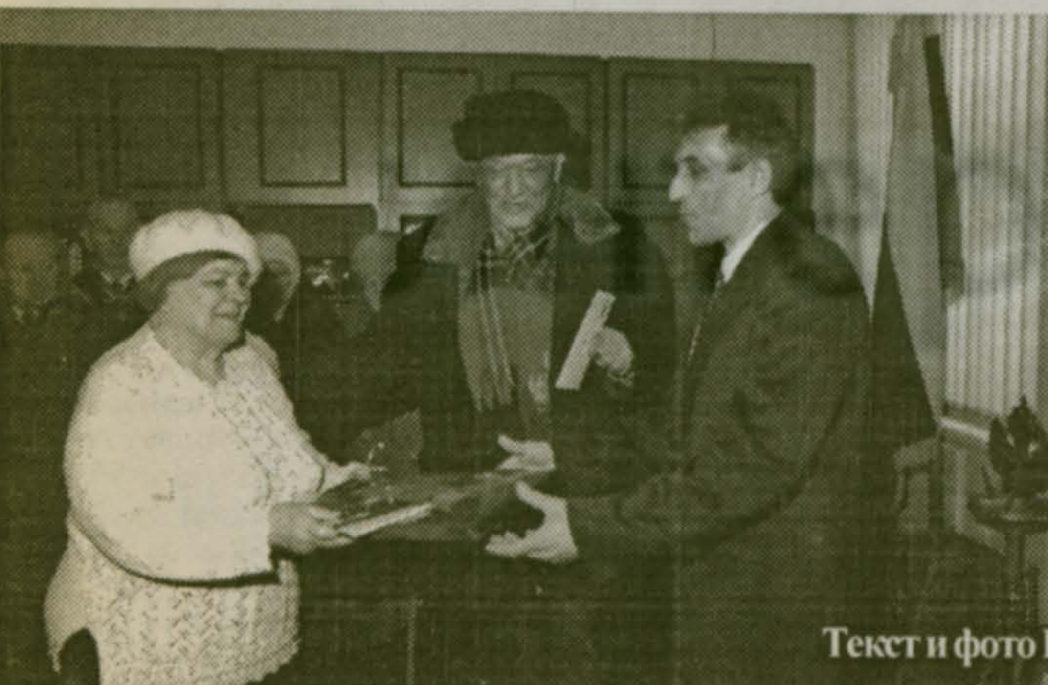
Текст и фото П.САЖИНА

В концерте, состоявшемся потом, интересно выступили и ветераны, и молодежь. Военнослужащие из подшефной части показали себя настоящими артистами: и в вокале, и в рукопашном бою.