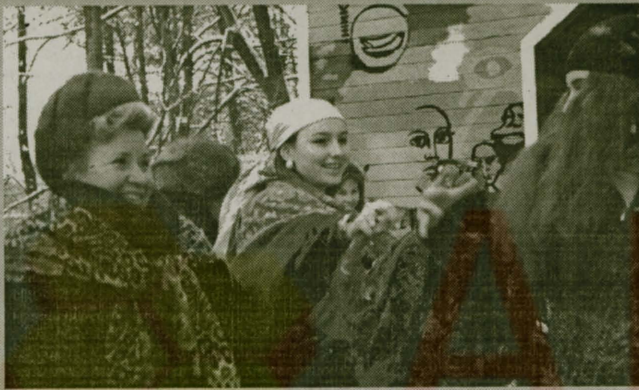
Да, судя по погоде, зима уходит не собирается. А ведь мы её давно проводили. Да так, что после этого и оставаться как-то неудобно. Но, всё по порядку. (См. стр. 3)