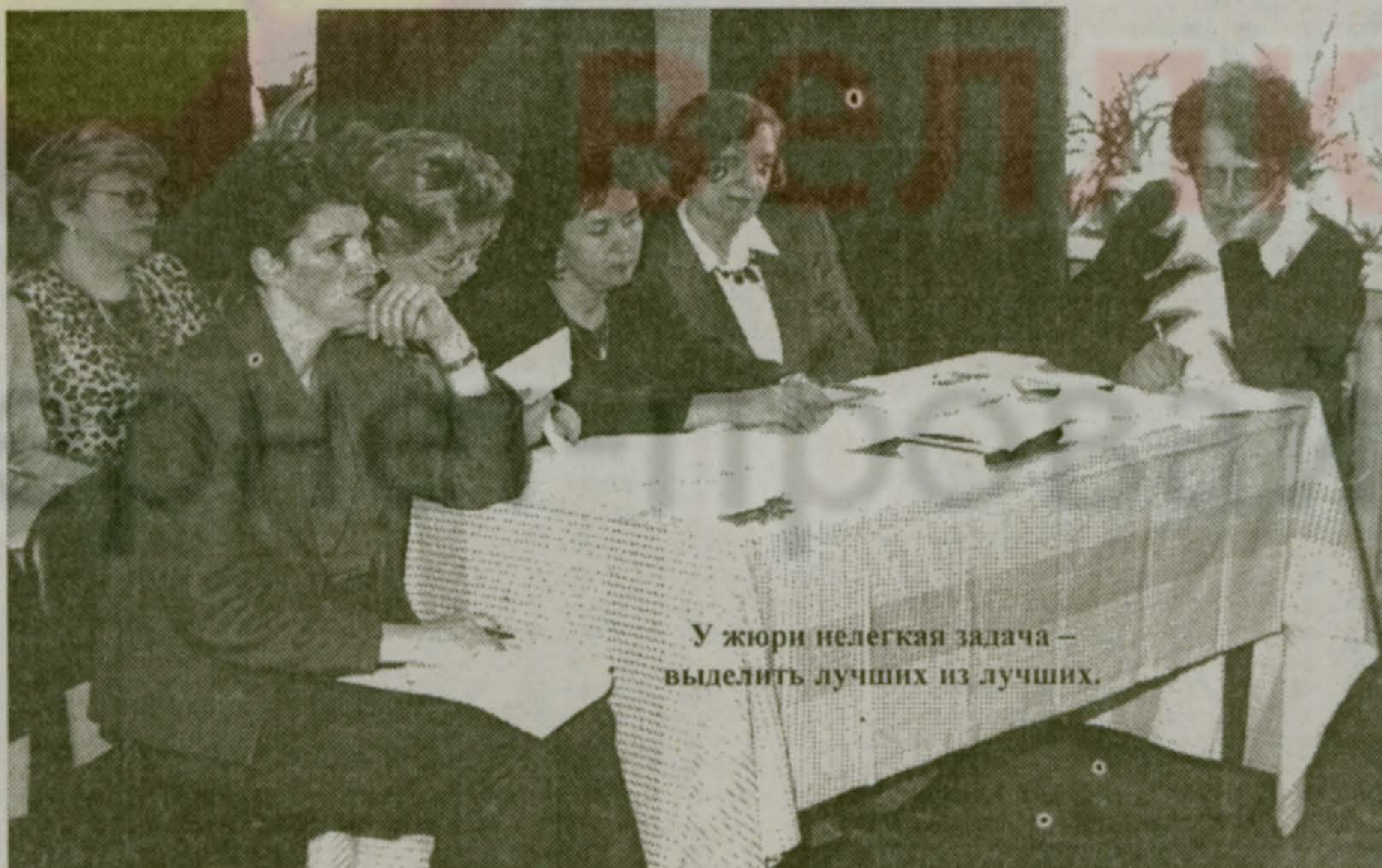
У жюри нелегкая задача – выделить лучших из лучших.