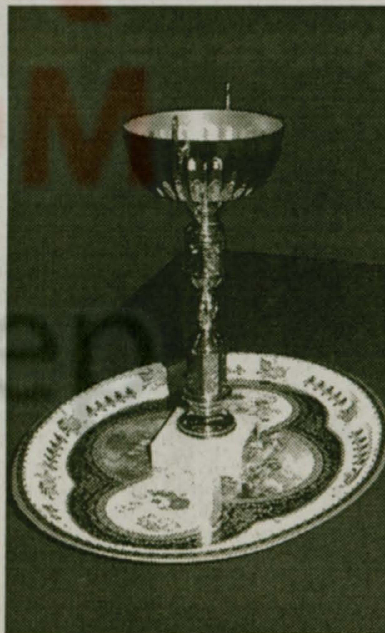
(Окончание на стр.3)

В следующий игровой день, 22 марта, Школа № 52 переиграла Милицию, МГАФК выиграл у "МВ", Школа № 47 у Теплосети, а Администрация у Гимназии № 46.