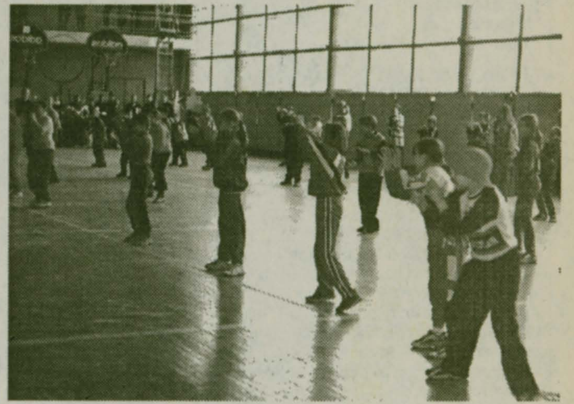
Но финал турнира прошел под крышей

Статьи, точно таким же образом распределены места и в таблице розыгрыша по футболу. В прошлом номере «МВ» (не совсем по вине редакции) были неправильно опубликованы результаты футбольного первенства школ. Приносим свои глубокие извинения. Простите, если можете.