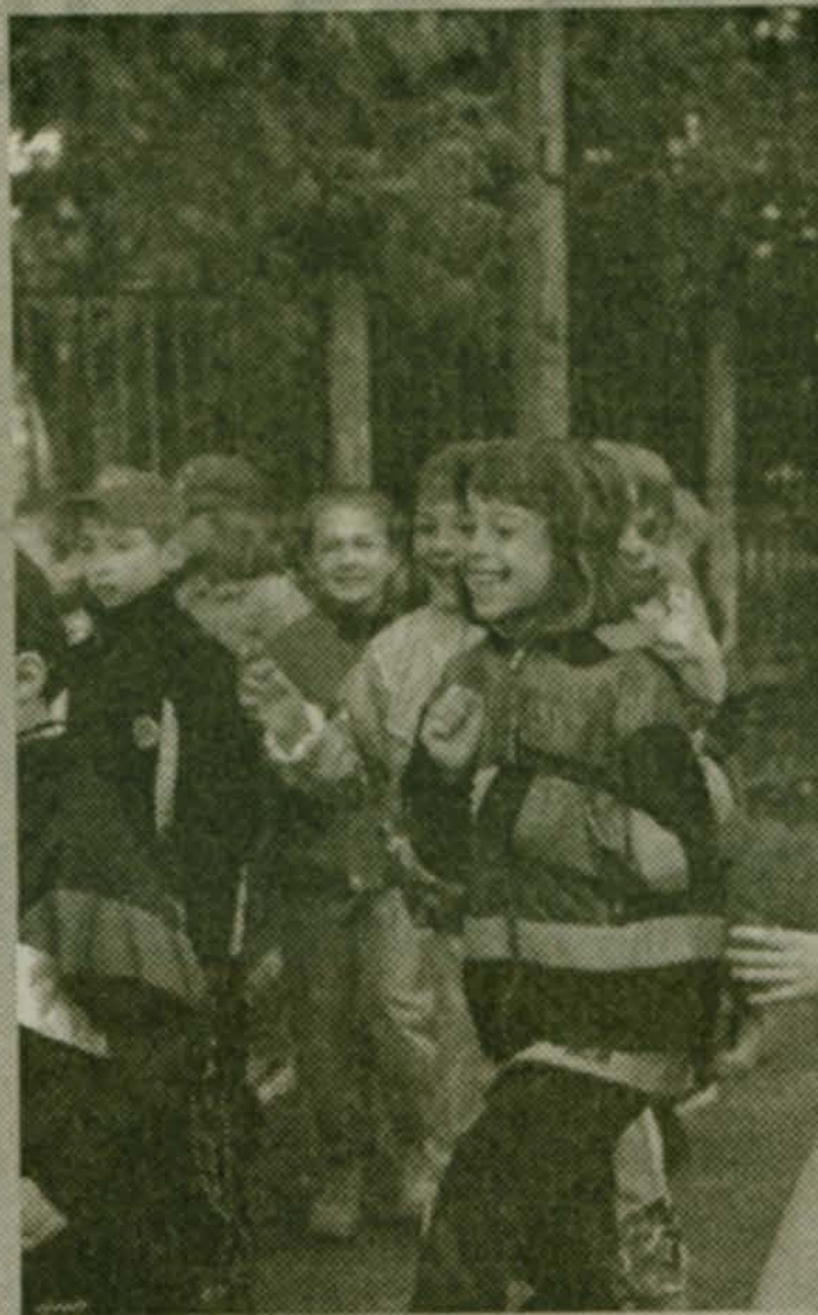
(Окончание на стр. 3)