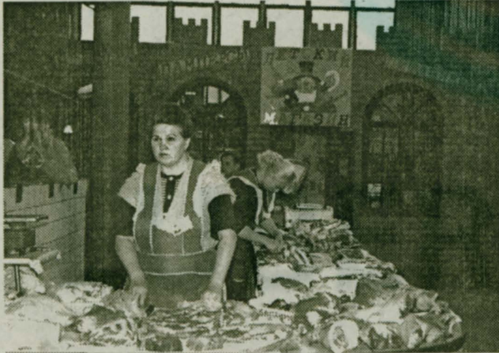
Малаховский рынок и сегодня – один из лучших в регионе, предмет нашей гордости. Но – не только он один.