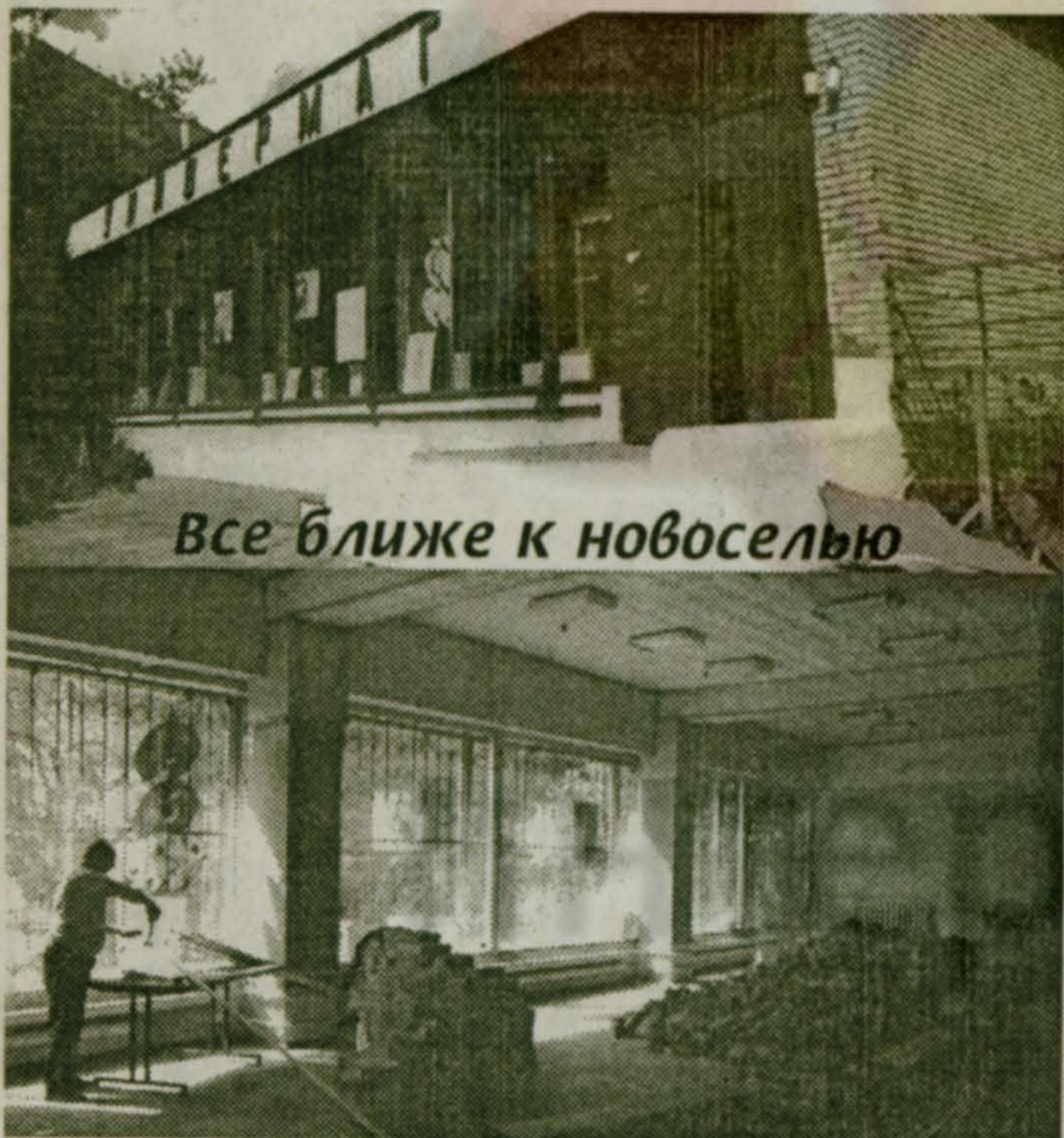
Все ближе к новоселью