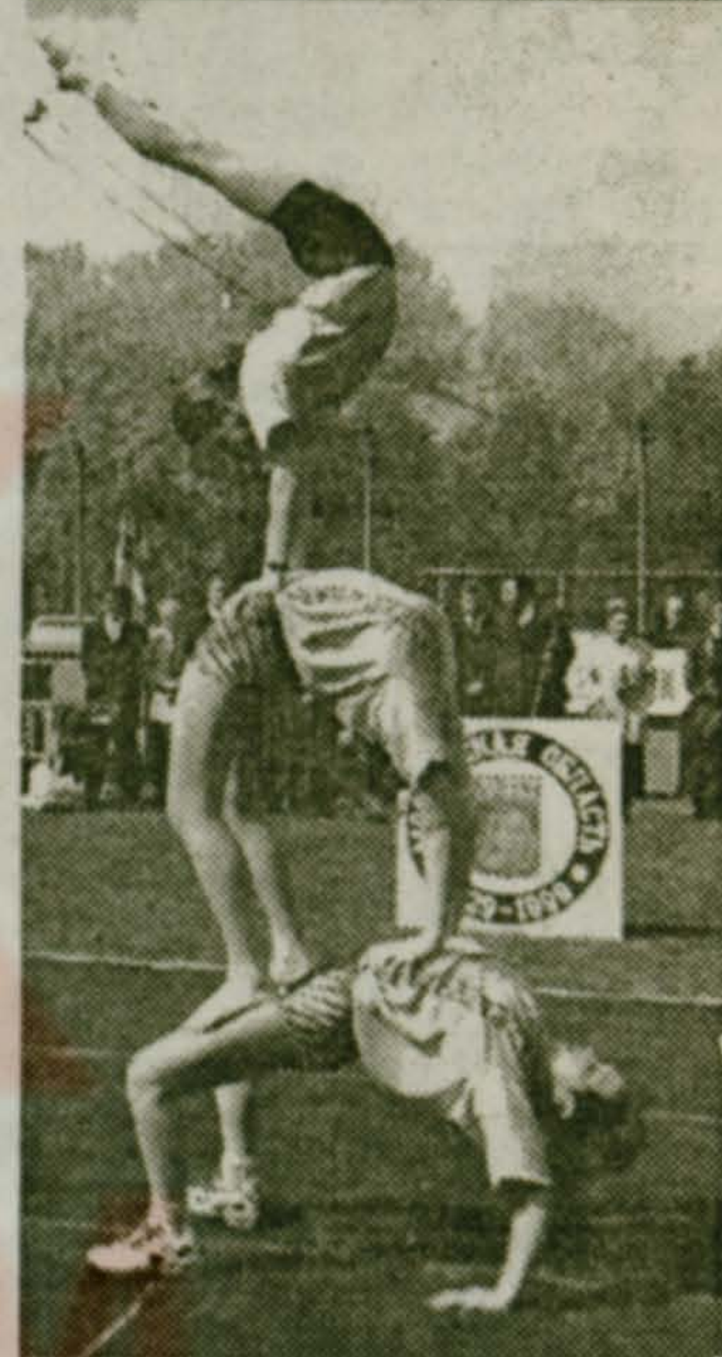
Спортивные праздники и фестивали — поселковые, областные, всероссийские — в МГАФКе и в Москве.