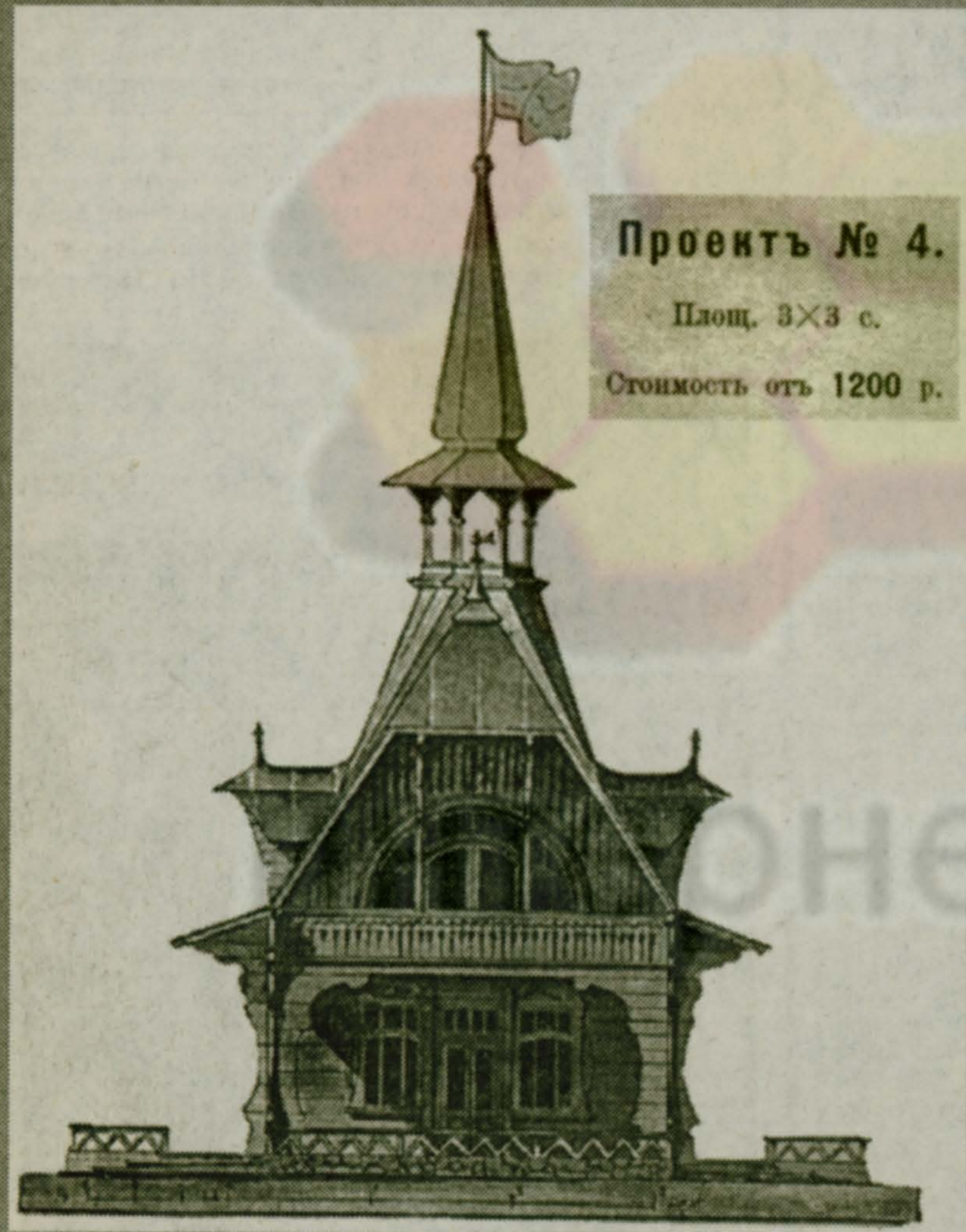
Проект № 4. Площ. 3x3 с. Стоимость от 1200 р.

Итак, с этого номера и далее — и только у нас — дачные проекты столетней давности. Р.Н.