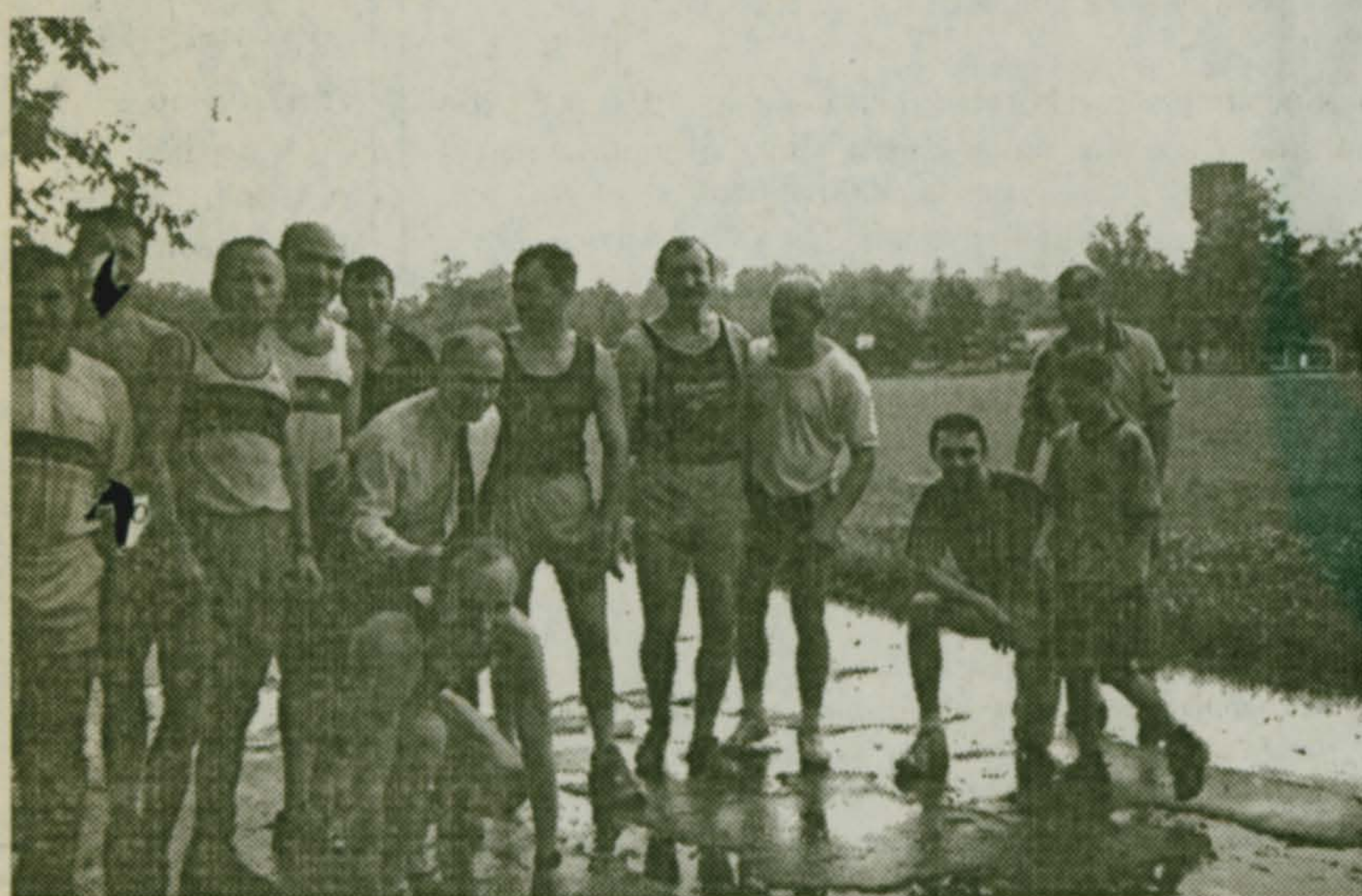
Перед стартом на миле «Михалыча» 23 июня 2001 года. Участники встречи: мастера спорта, чемпионы СССР, призеры международных соревнований. И прочие, прочие...