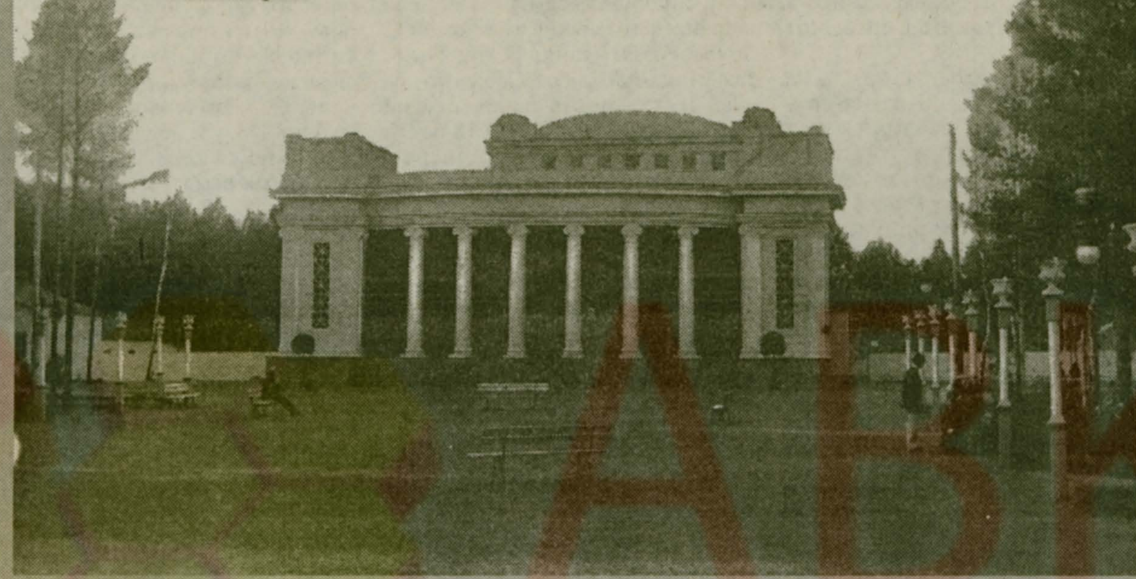
Малаховка. Театр. 1911 год. Изд. А.А.Горожанкина