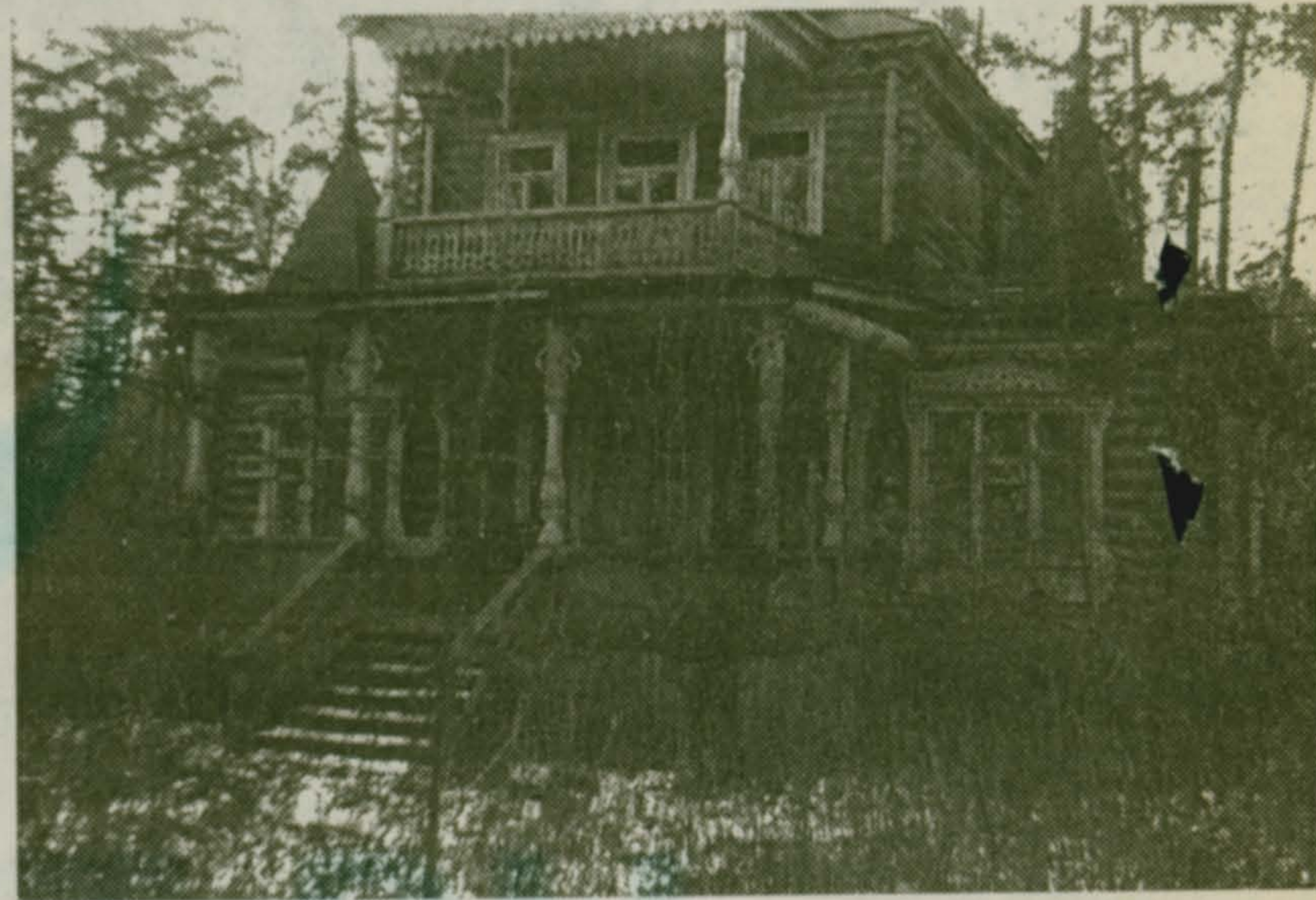
Дом 19 на Большом Кореневском шоссе

Все дома в Малаховке имели каменные опоры. Этот камень возили из Нового Милета. Организовывал добычу камня и продажу местный крестьянин Семен Кузнецов. Дело было поставле-