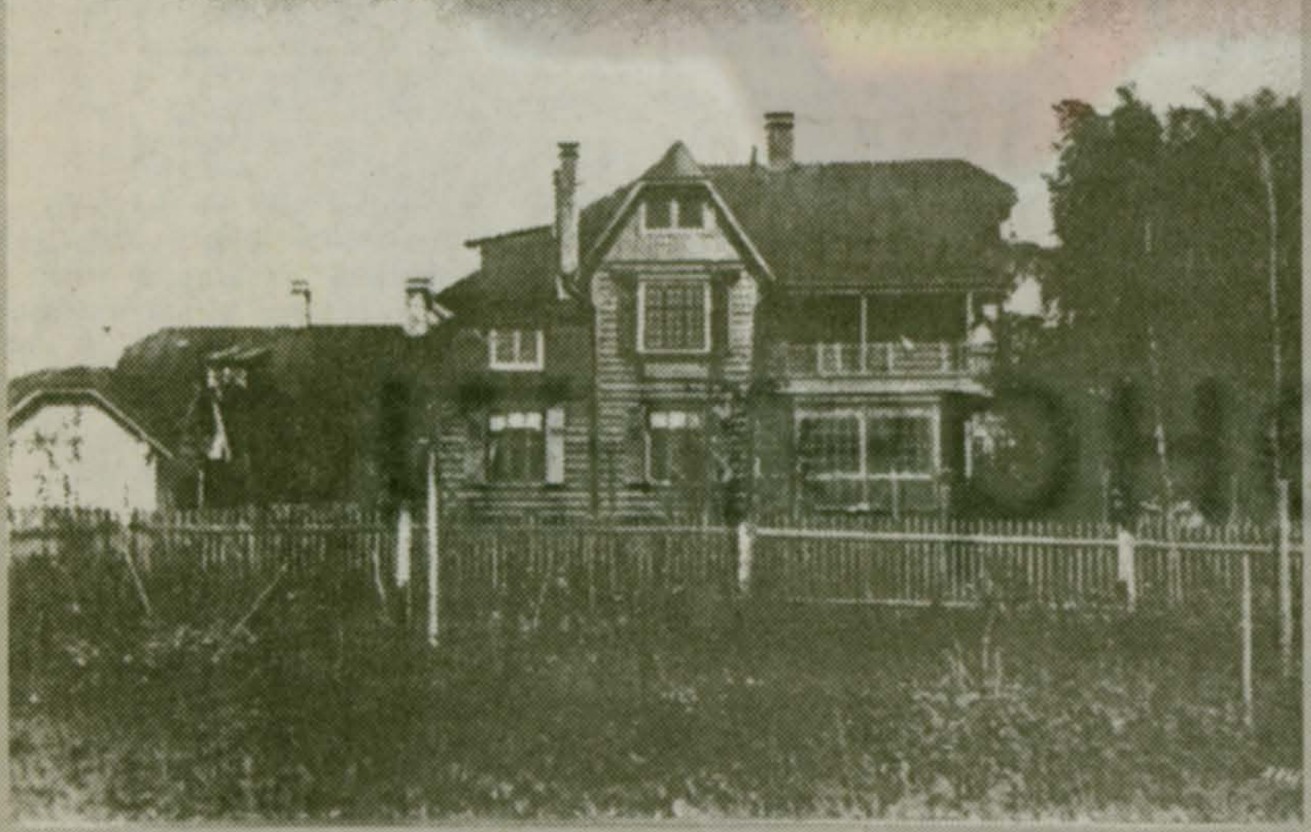
О судьбе дома Телешова - в рубрике «О чем писал «Малаховский вестник» 10 лет назад (стр. 2, с продолжением в сл. номере).