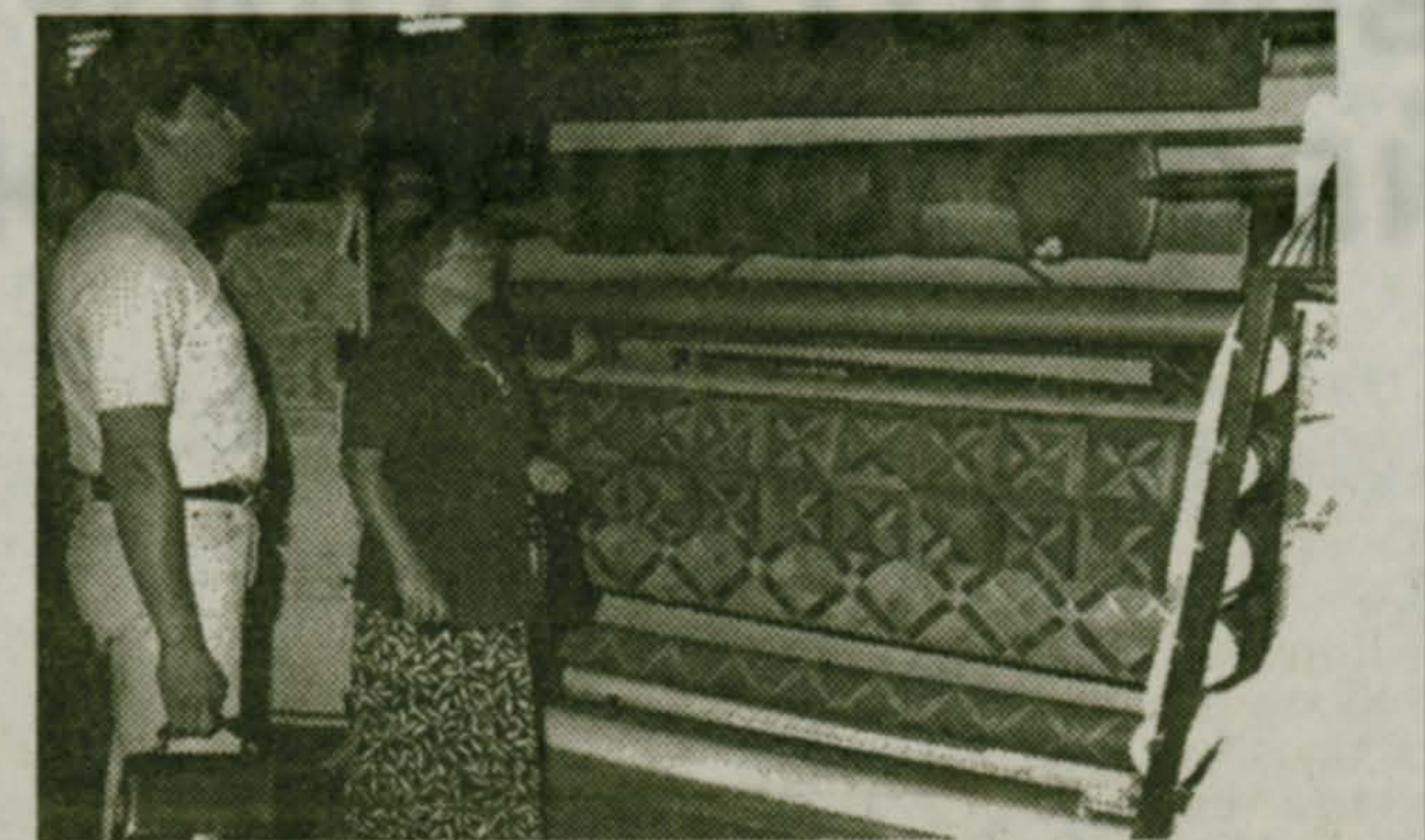
Предлагает большой выбор отечественной и зарубежной сантехники.

ООО «Логика» приглашает покупателей в Магазин «ТОВАРЫ БЫТА» Малаховка, Большое Кореневское шоссе, д. 1 т/факс 501-10-72, склад 501-50-09