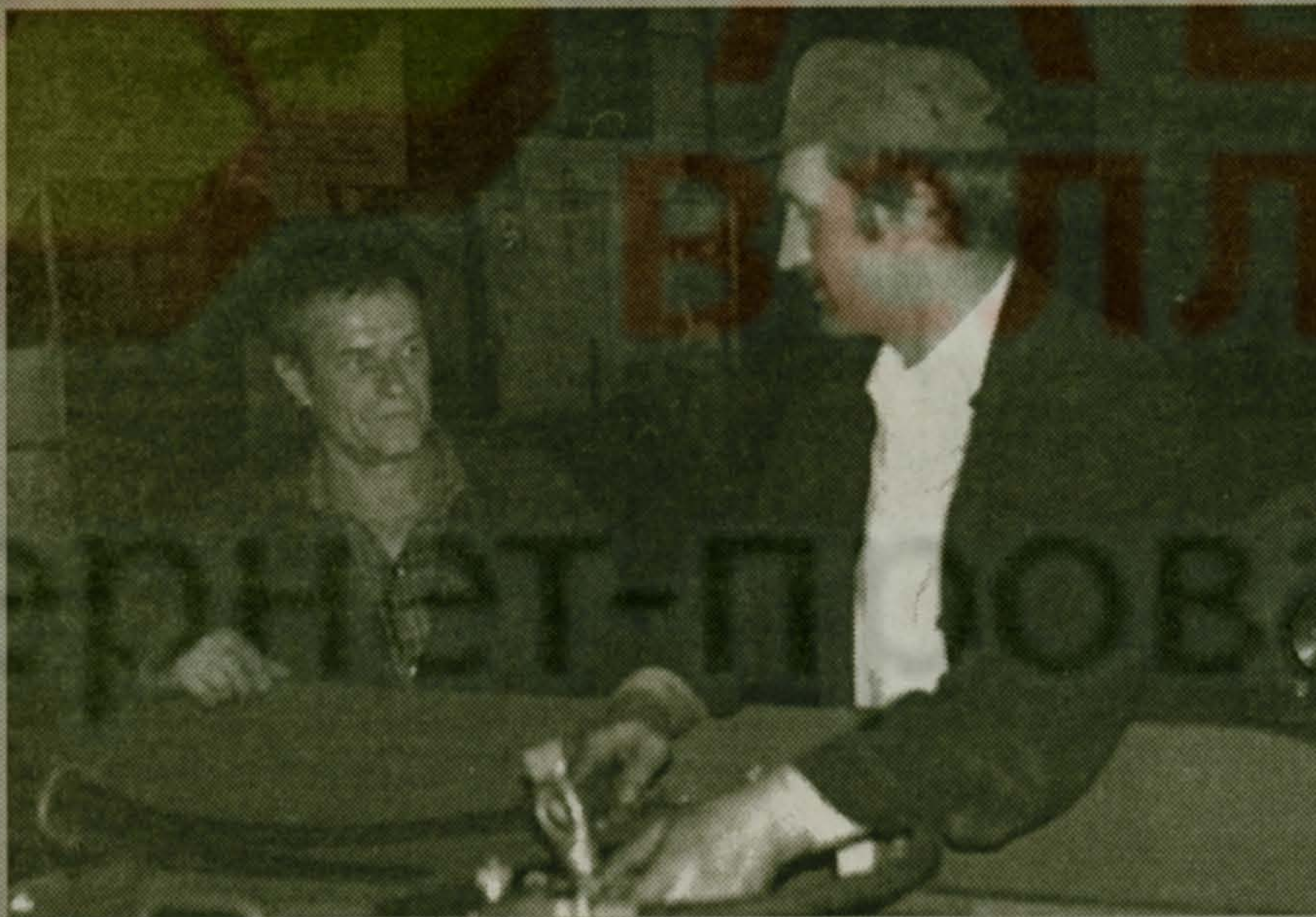
Может, был прав «отец народов», что кадры решают все?