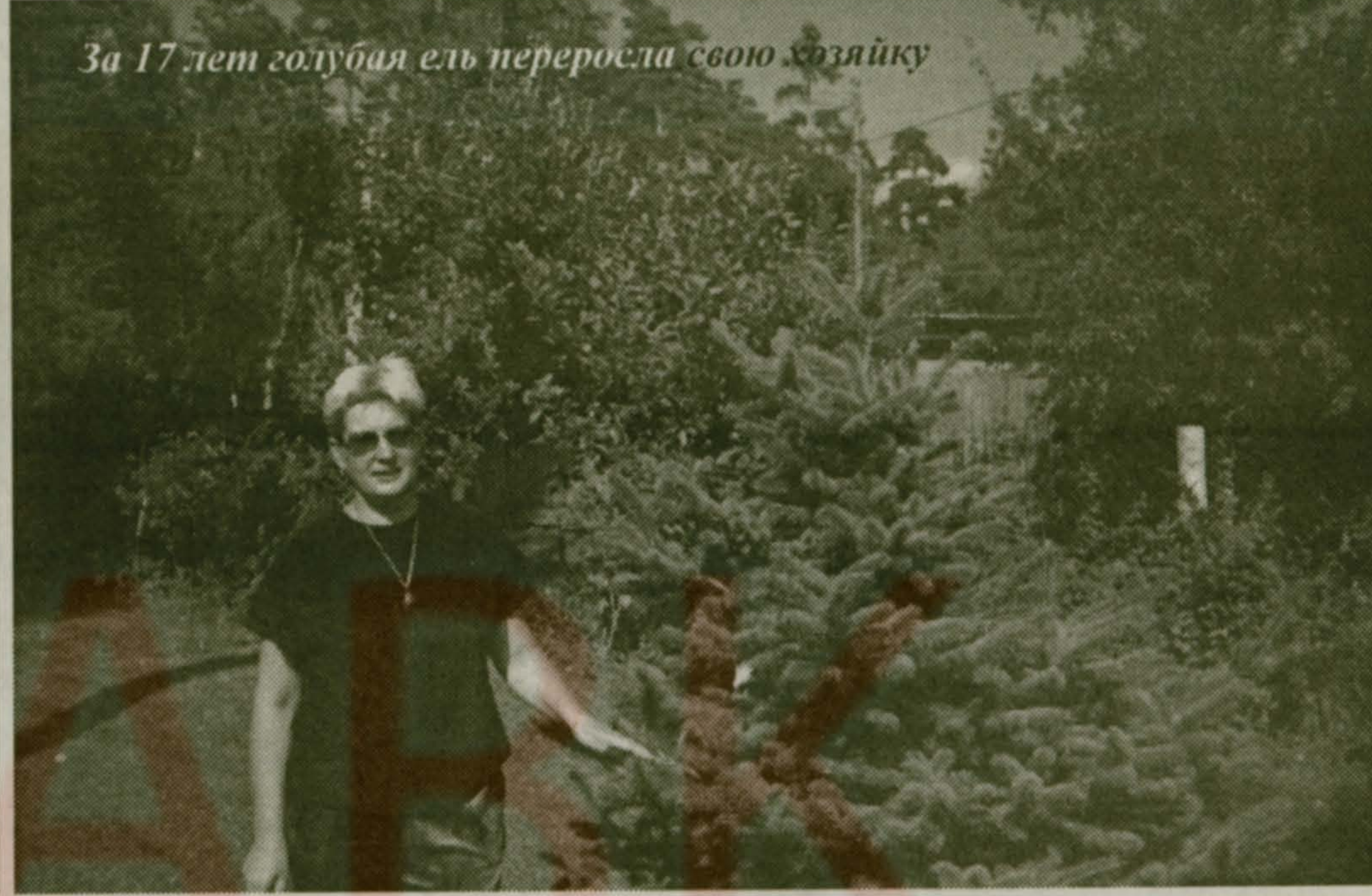
За 17 лет голубая ель переросла свою хозяйку