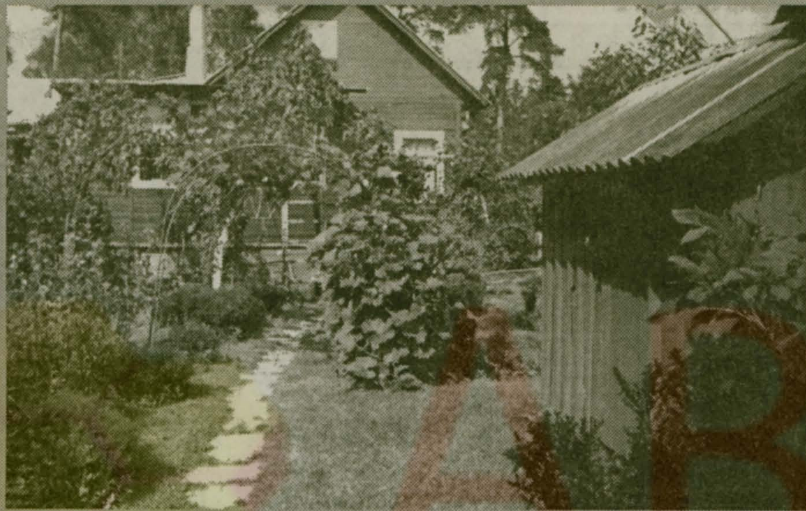
Материал «Снился мне сад» - читайте на стр. 3