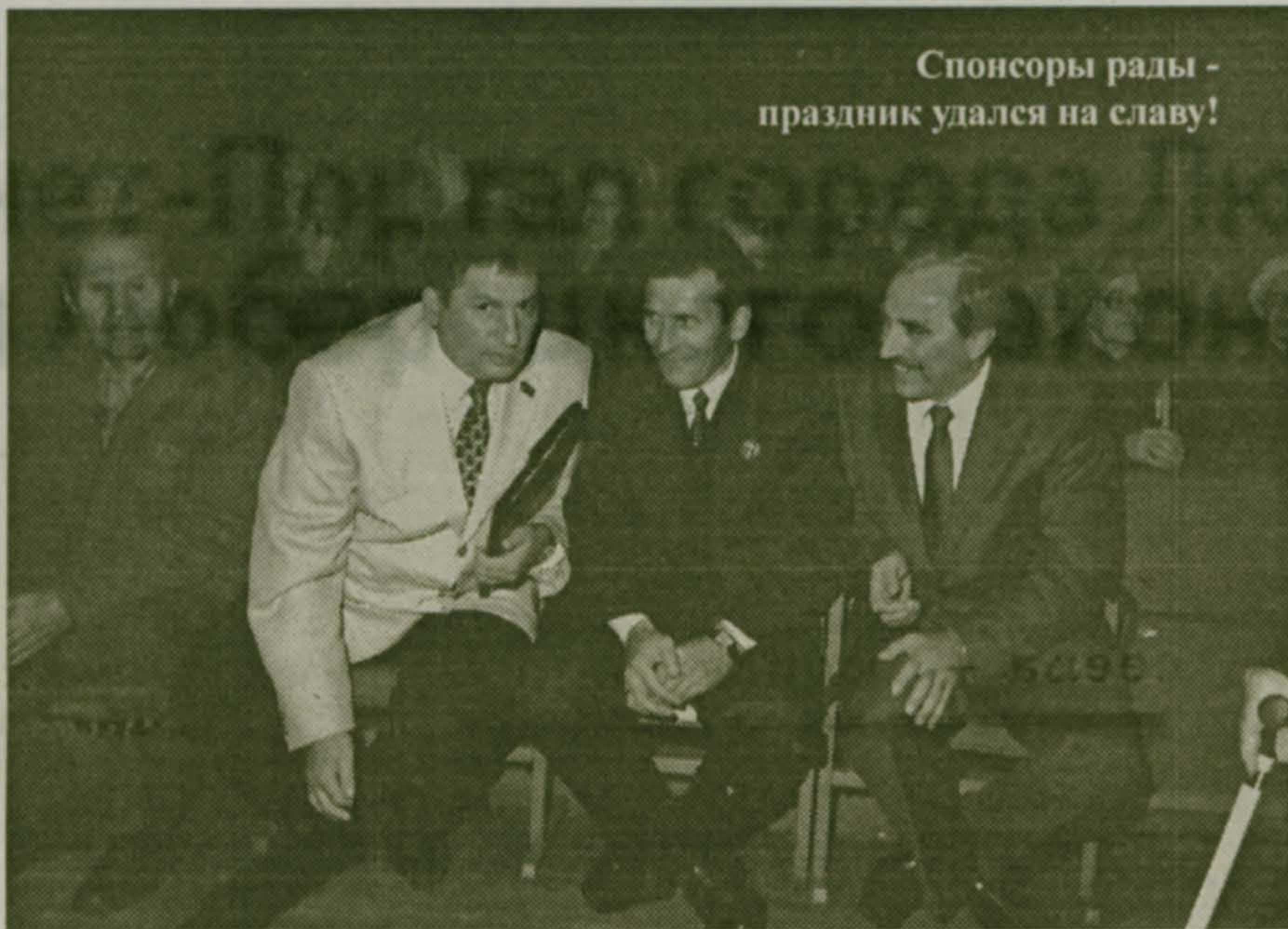
Спонсоры рады - праздник удался на славу!