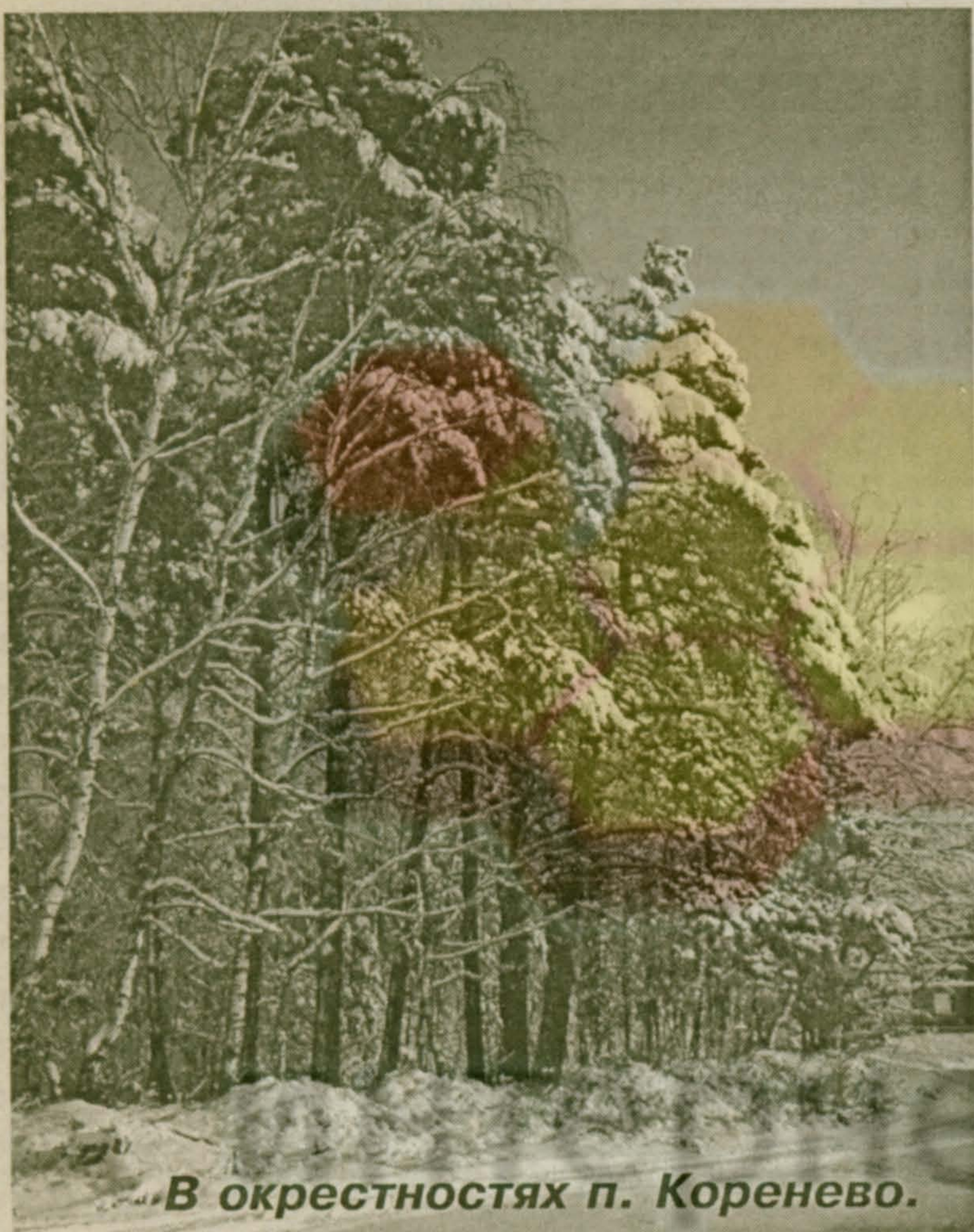
В окрестностях п. Корнево.