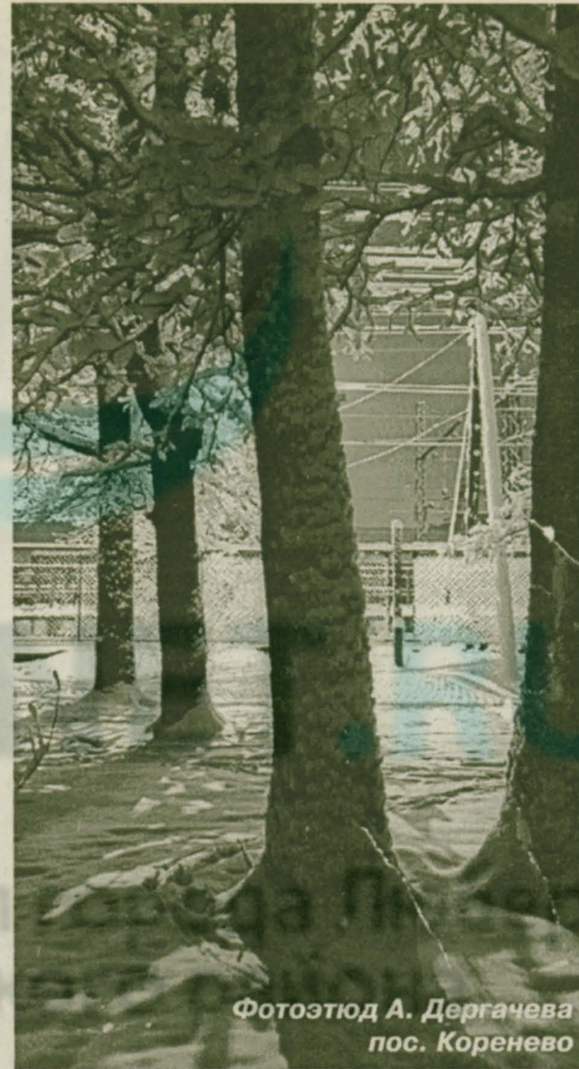
пос. Коренево