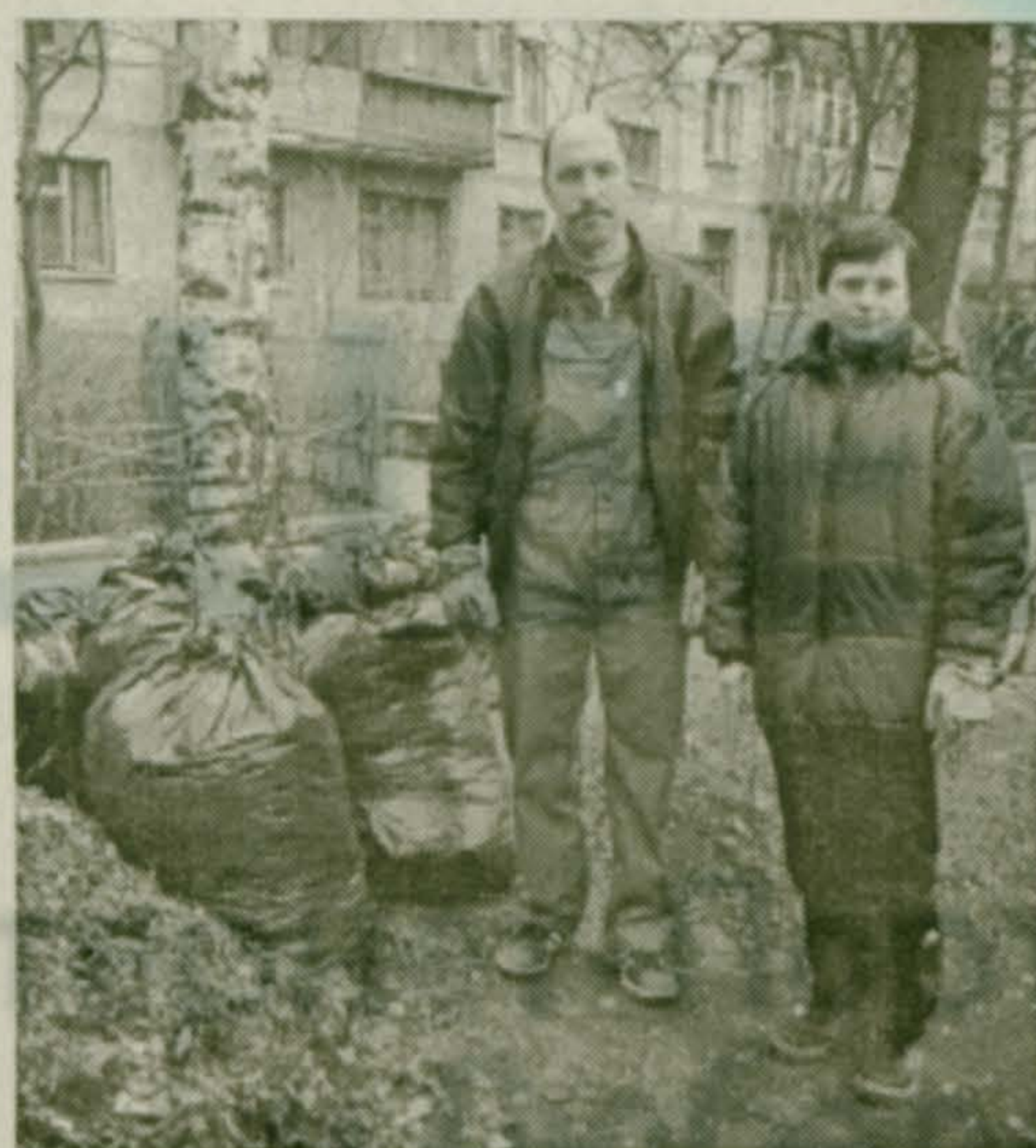
Пока родители на субботнике...

21 апреля состоялся рейд по проверке санитарно-гигиенического состояния поселков Красково и Коренево. В нем участвовали руководители администрации поселка, МЖКП и редакция газеты «Наше Красково». Действительность такова, что наряду с уже чистыми дворами и улицами еще много мест, глядя на которые хочется отвернуться и не видеть их. Самое неприятное заключается в том, что человек очень быстро привыкает к плохому. Как будто так и должно быть. А равнодушие, леность - качества, которыми, к сожалению, отличаются некоторые наши жители.