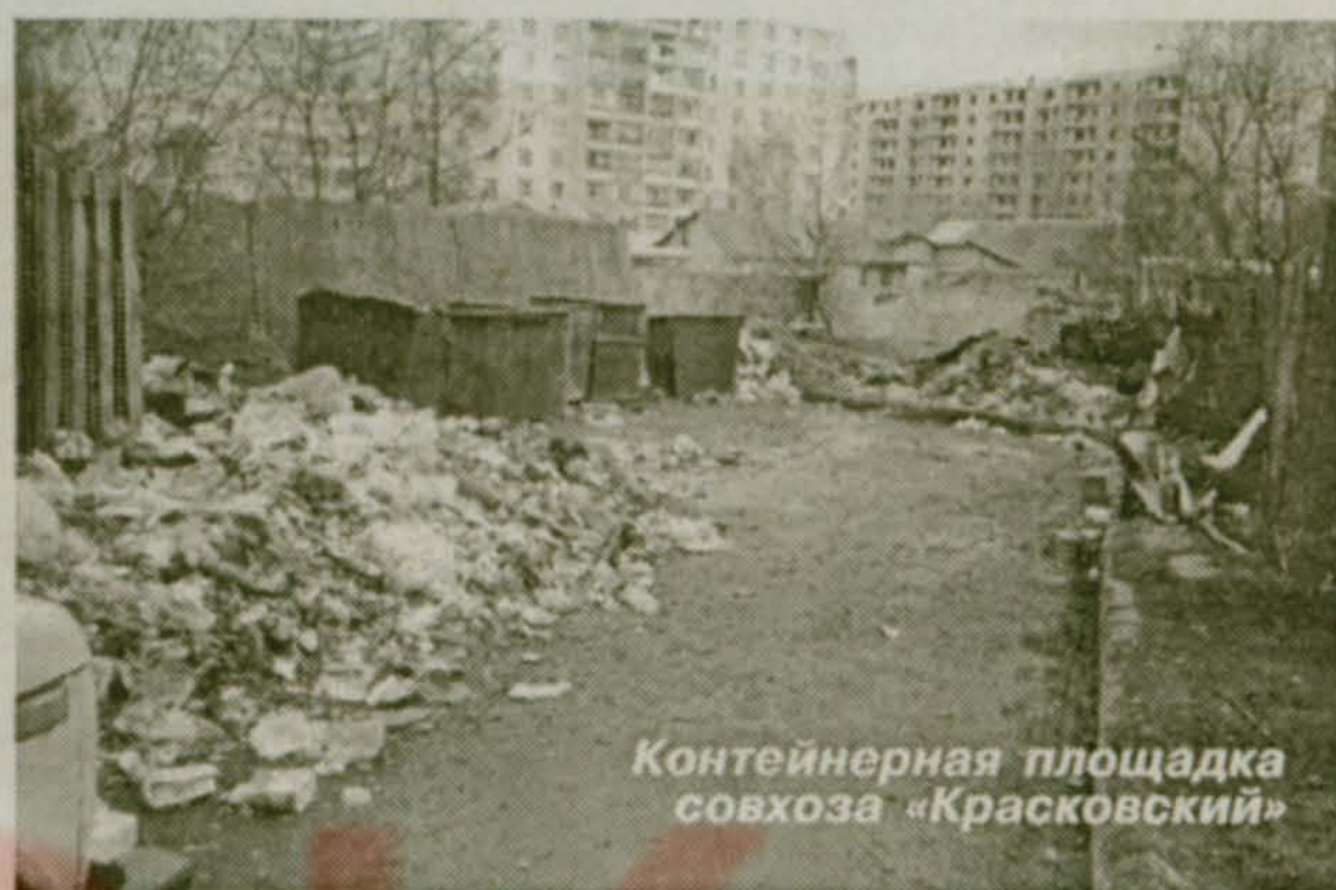
Контейнерная площадка совхоза «Красковский»