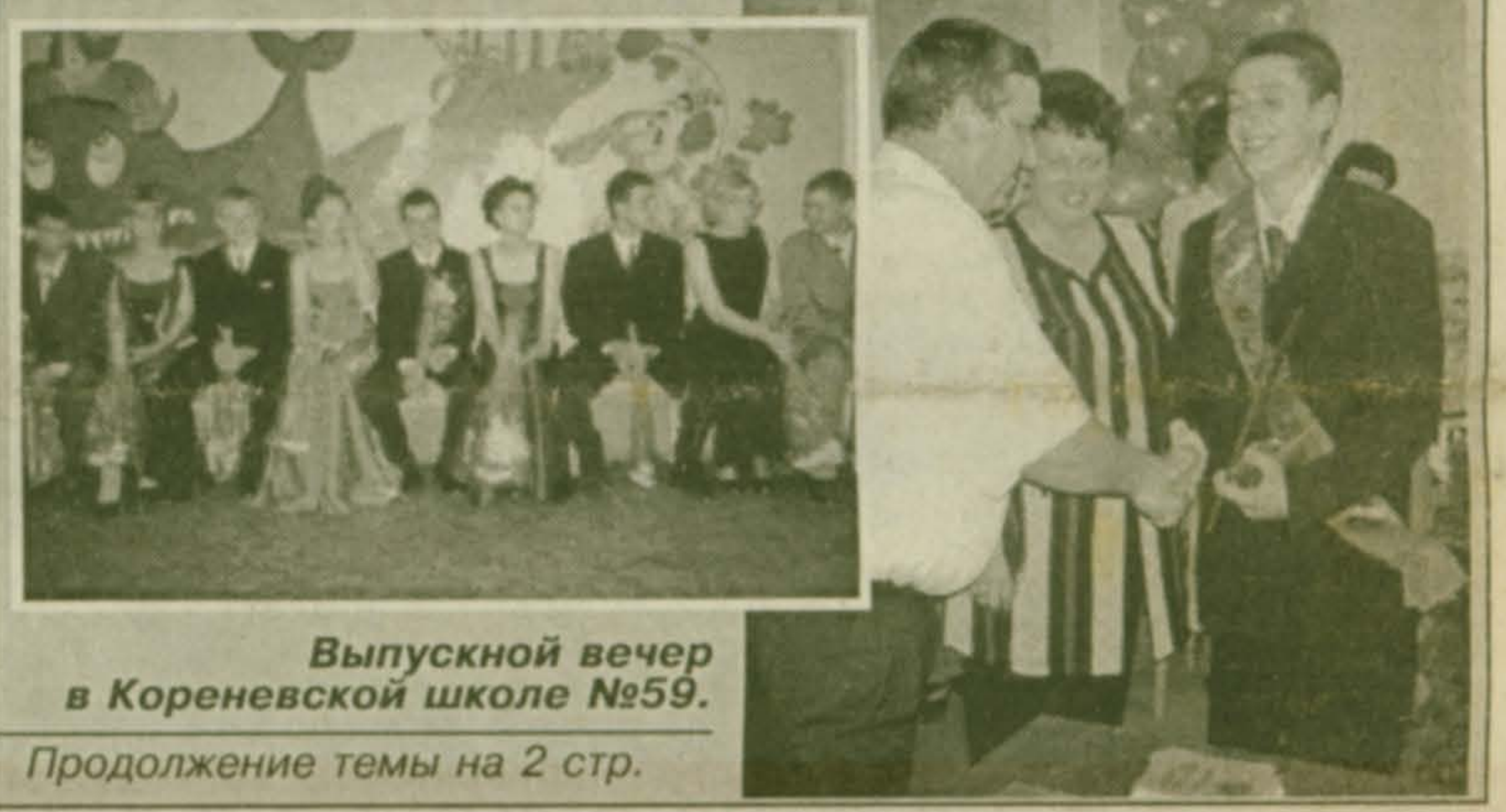
Выпускной вечер в Корневской школе №59.