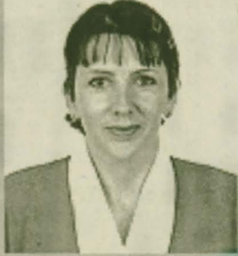
С уважением, О. ВЕРБИЦКАЯ

Как бы мне хотелось, чтобы произошло чудо, и через газету «Наше Красково» (она стала мне по-настоящему родной), я смогла бы обрести друзей. Я оптимистка и, как ребенок, верю в чудеса. И еще - я обязательно сохраню газету с моими стихами и в начале учебного года, когда поведу своих двоих старших детей в школу, покажу своим учителям школы № 59, которые учили меня. Пусть и они порадуются. Это и их заслуга. Спасибо за ваши отзывчивые сердца.