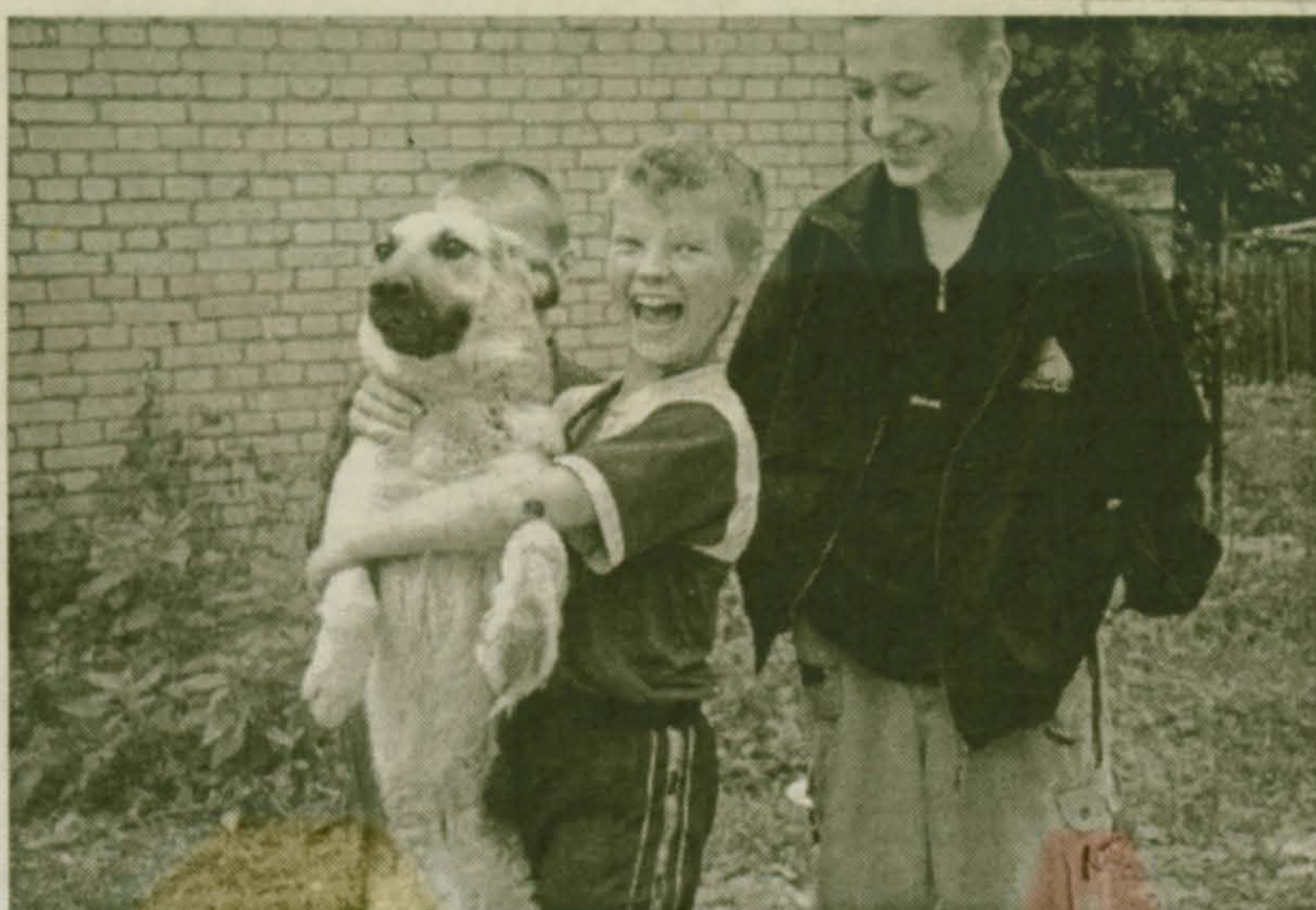
Каникулы с Бобиком.

Продается 2-комн. квартиры улучшенной планировки или меняется на 1-комн. квартиру. Тел. 557-14-11, с 8 до 19 часов