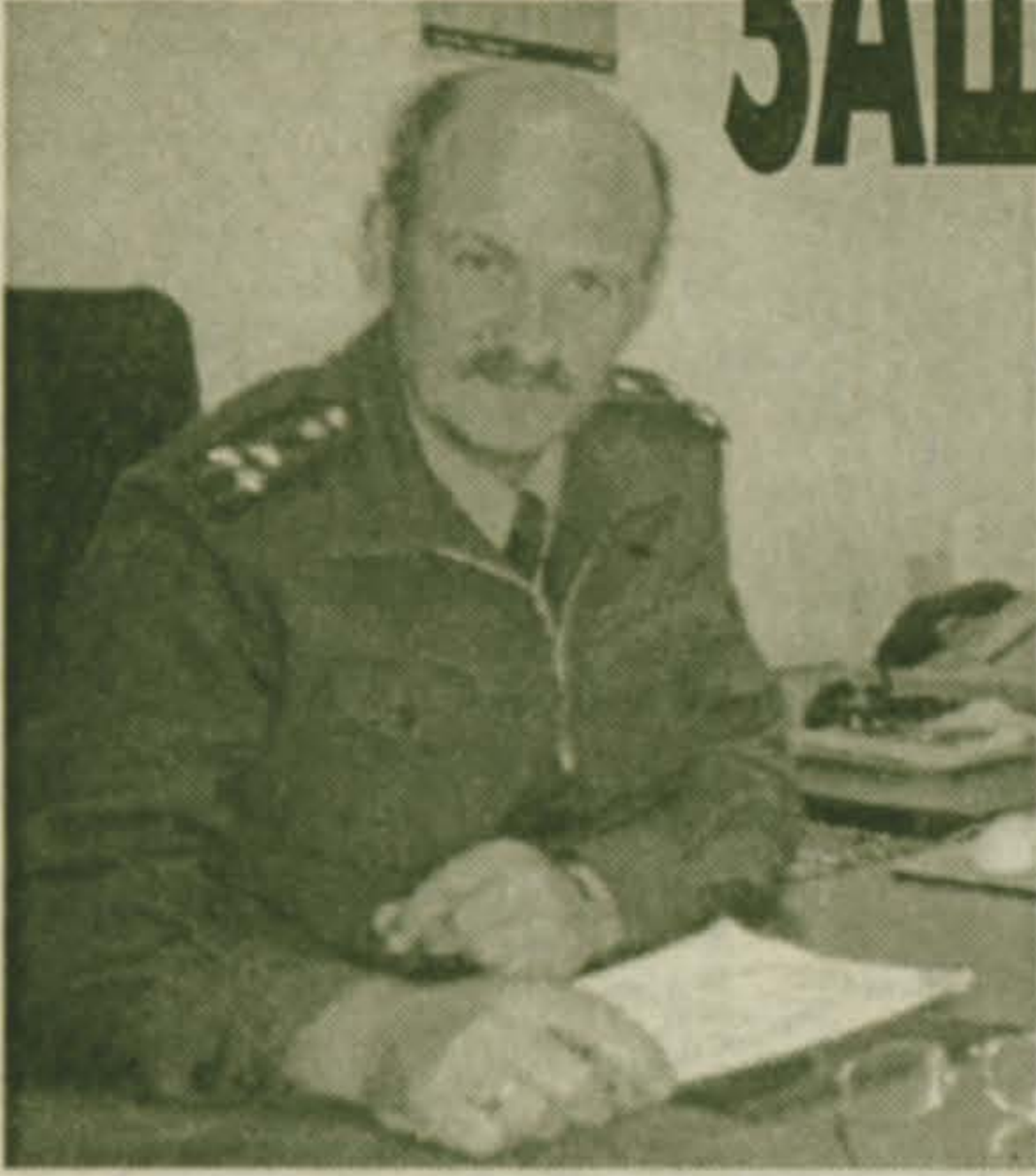
Окончание. Начало в №36.

В войсковой части, расположенной в пос. Удельная, была раскрыта наркомафия. Наркодельцы понесли заслуженное наказание. Откуда все это берется? Телевидение, печать усиленно насаждают нам этот нездоровый образ жизни.