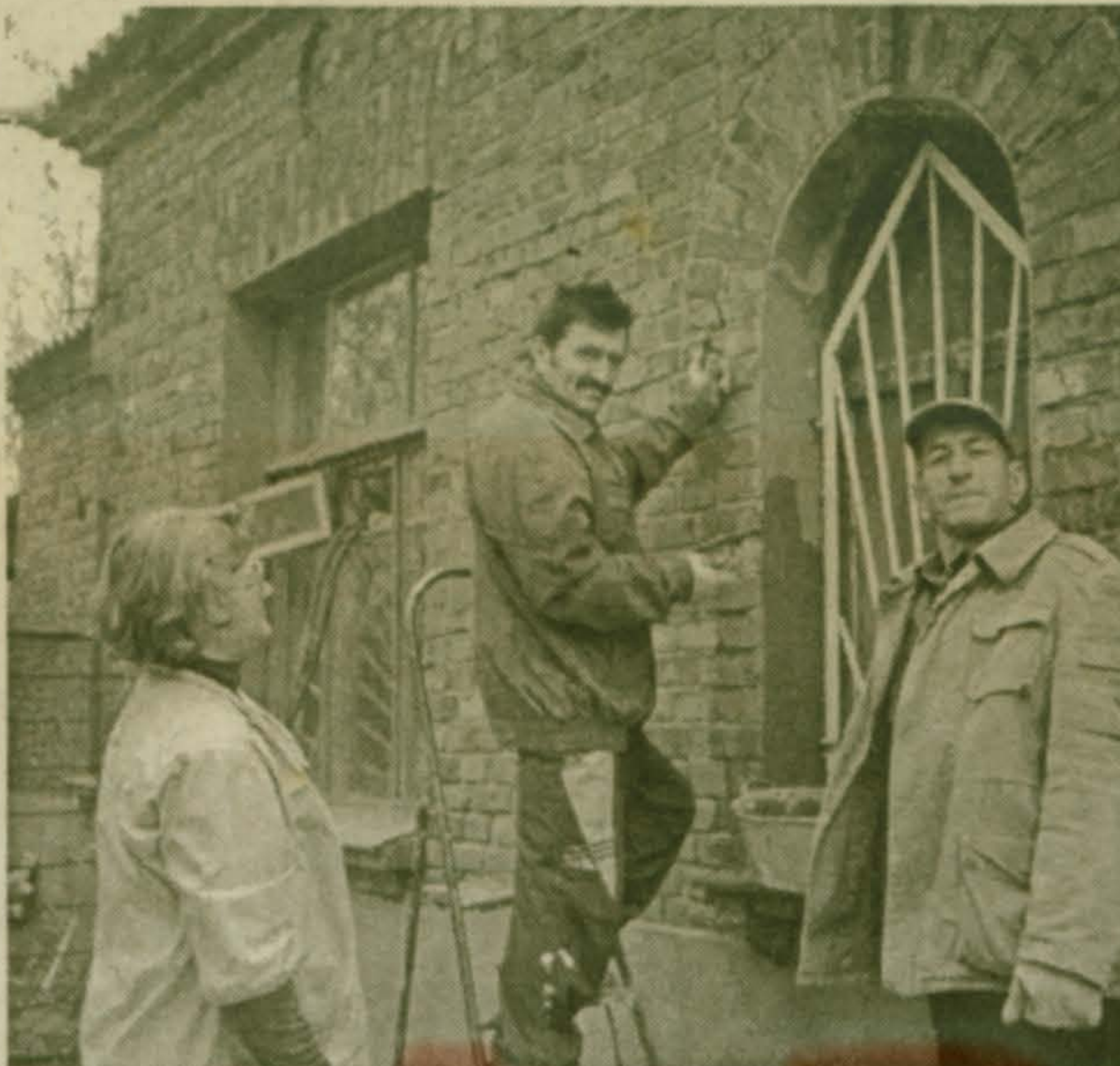
без срочной медицинской помощи. Сегодня медики говорят спасибо и своему депутату, и главам поселков и, конечно, строителям.