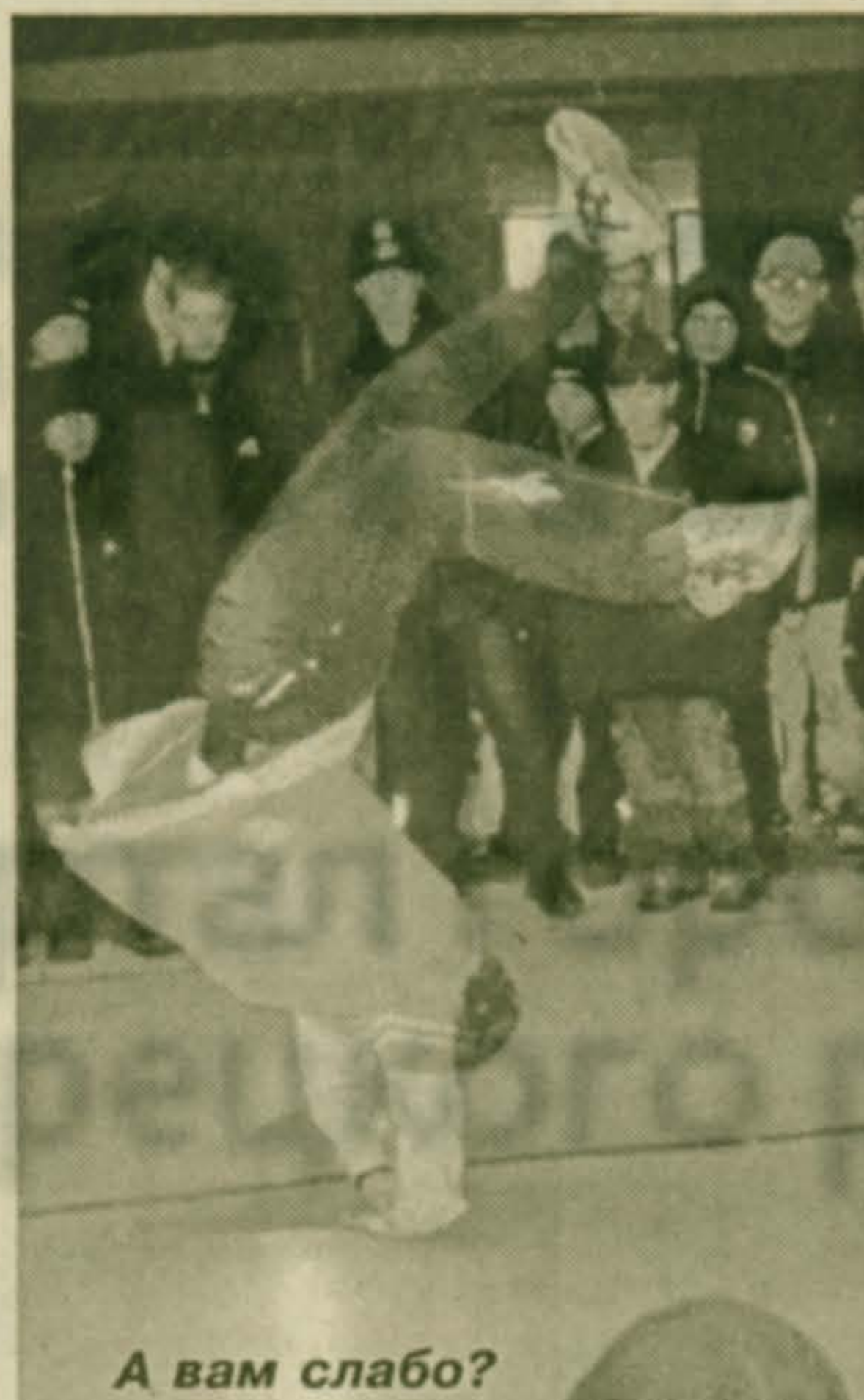
А вам слабо?