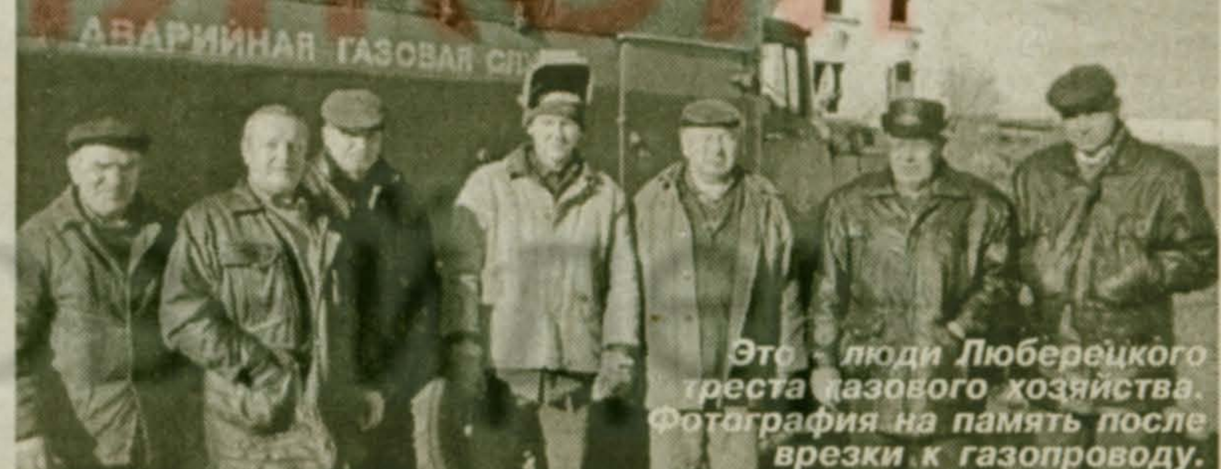
Это - люди Люберецкого геста газового хозяйства. Фотография на память после врезки к газопроводу.

25 октября состоялась врезка к газопроводу, который будет обеспечивать голубым топливом жителей д. Машково. Так уж получилось, что российский газ дошел до Европы раньше, чем до деревень нашего муниципального образования, расположенных под боком у Москвы.