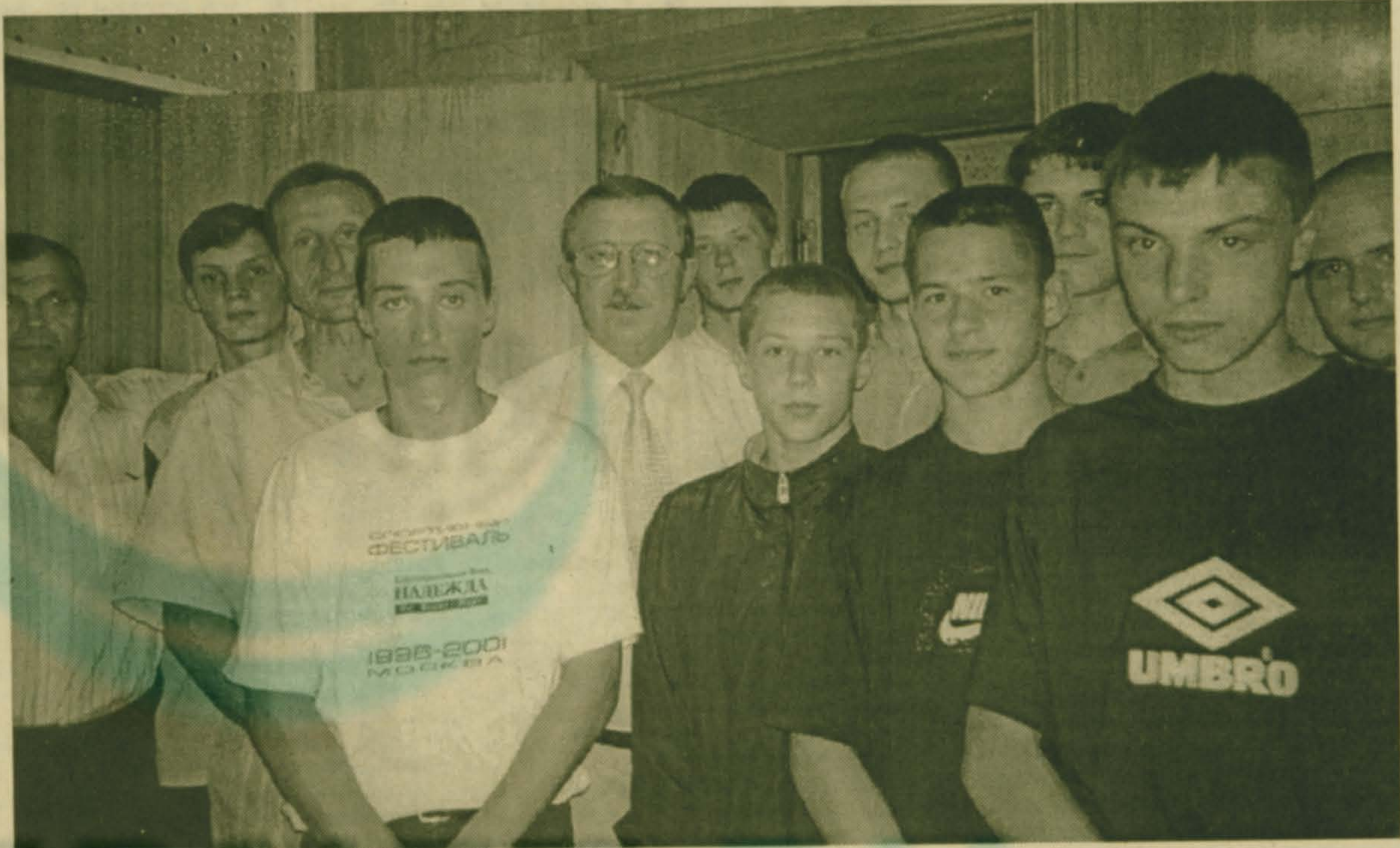
Глава поселка среди участников футбольного турнира дворовых команд.

-Недавно в Красковском культурном центре состоялся фестиваль самодеятельного творчества «Зимняя радуга». Он стал уже традиционным, приносит много радости и взрослым, и детям. Мне пришлось услышать положительные отзывы от зрителей. Но за