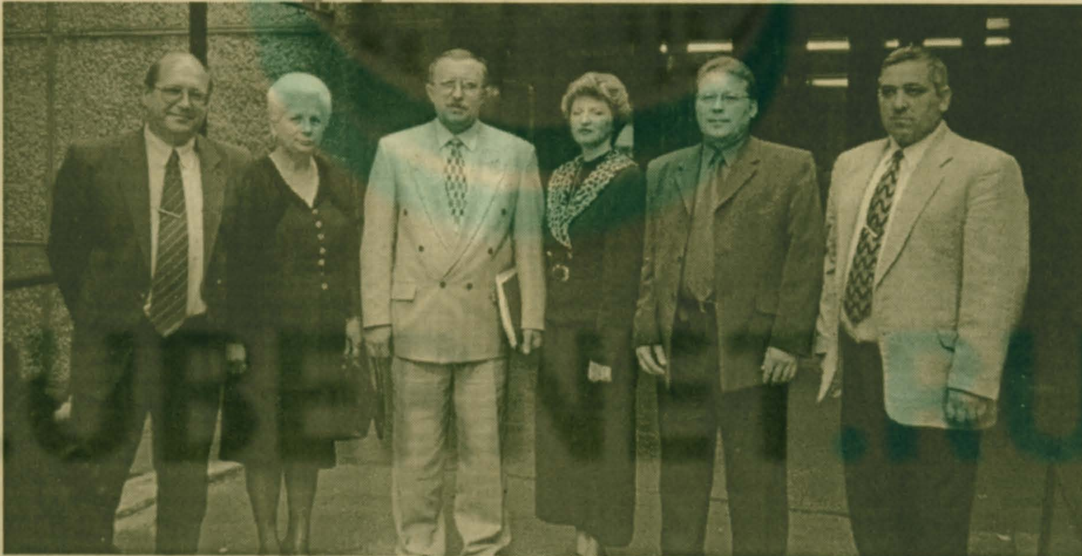
Снимок на память с руководством Люберецкого комитета по образованию и директорами школ в День учителя.

Если не будут приняты какие-то шаги в сторону интересов пос. Красково, а население нашего поселка - это жители и избиратели Люберецкого района, я не