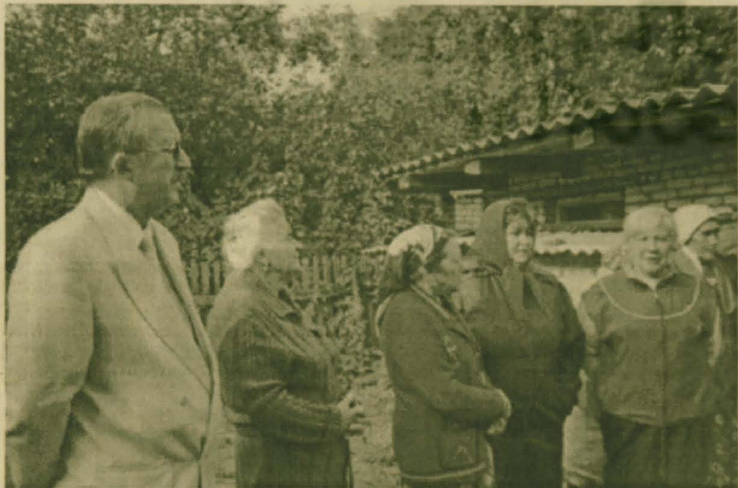
Разговор с жителями деревни Машково накануне пуска газа в их дома летом 2001 года.

смогу взять на себя ответственность согласиться с таким бюджетом. Он только по самому минимуму обеспечивает выполнение защищенных статей и не предусматривает решение проблем ЖКХ и бюджетных организаций.