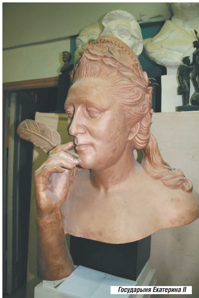
Государыня Екатерина II

- А что вы скажете о юноше с младенцем? Его в