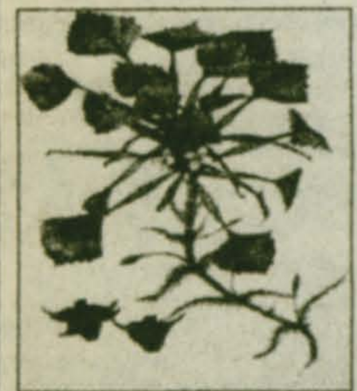
Рис. А. Шиличенко. Цветущий чилим.