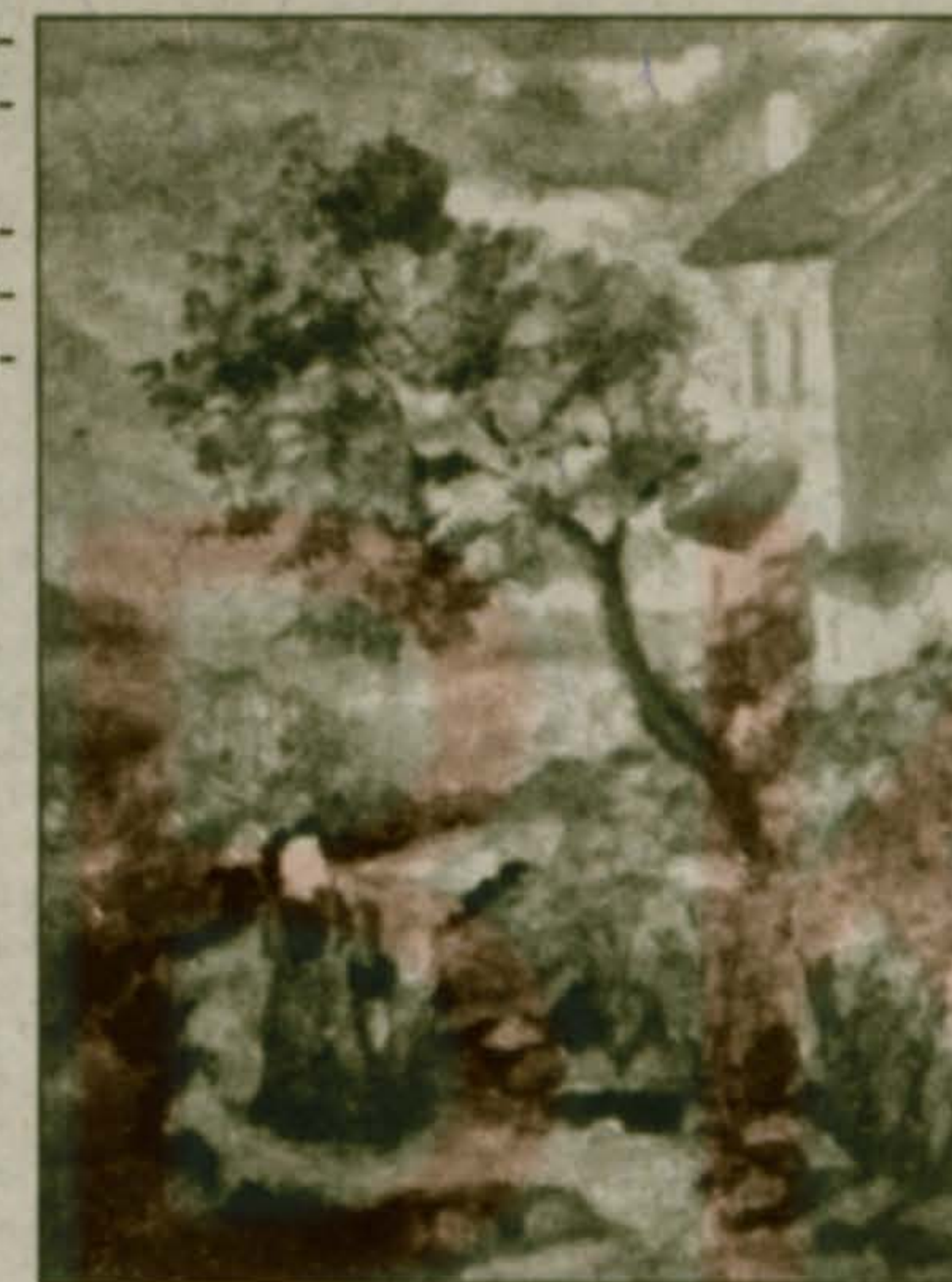
Вечер. Улица к бабушкиному дому.

Зазвонил телефон. Я оторвался от домашних дел и снял трубку.