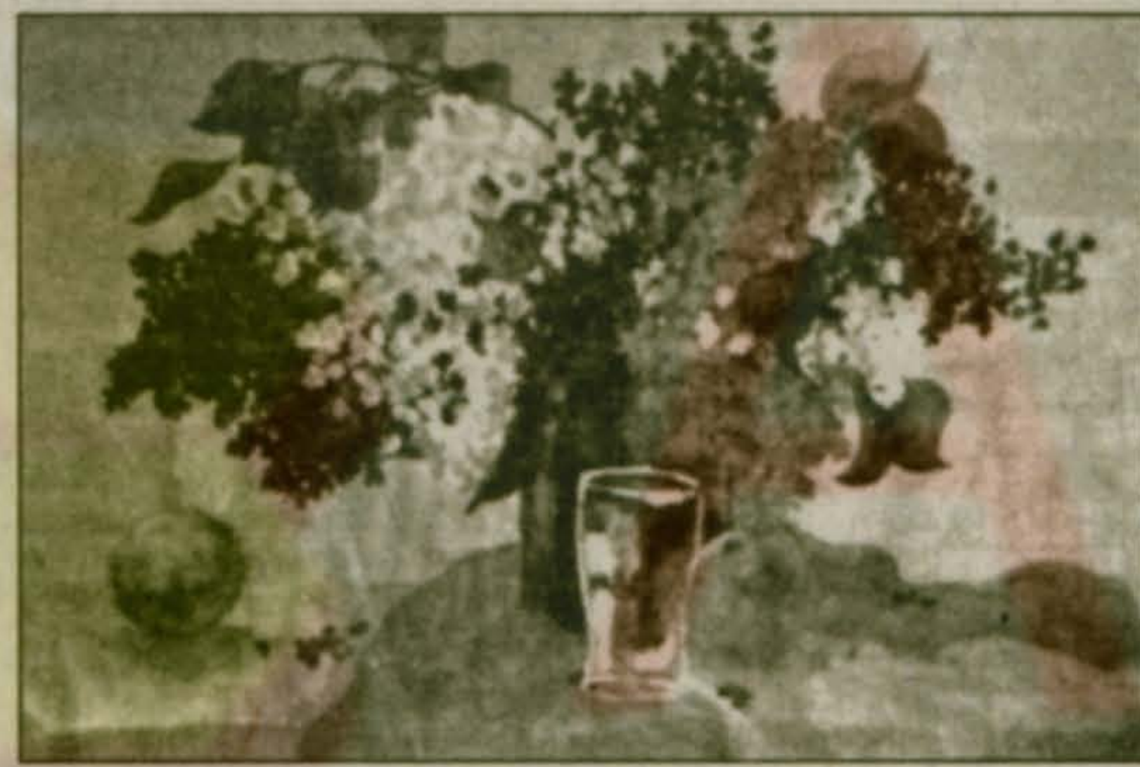
Натюрморт с сиренью.

Сегодня, как и обещала редакция «ТН», мы публикуем фоторепродукции лучших работ нашей землячки, которую специалисты уже назвали «удивительный вундеркинд».