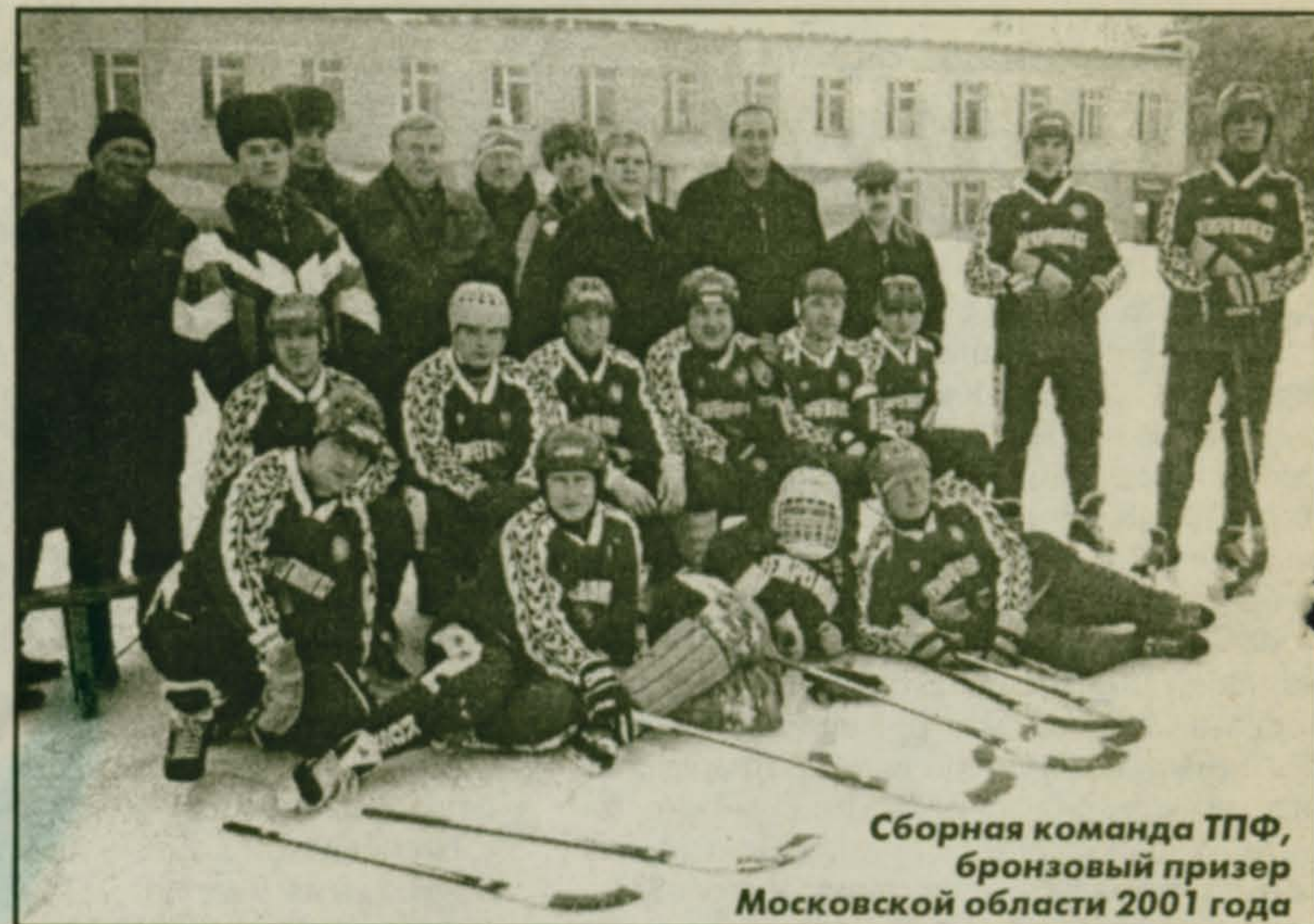
Сборная команда ТПФ, бронзовый призер Московской области 2001 года