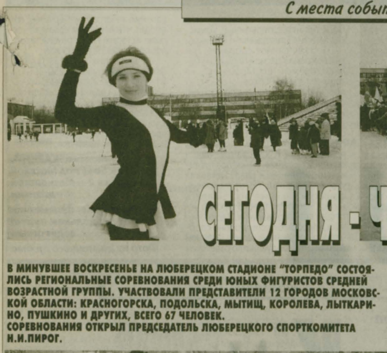
С места события