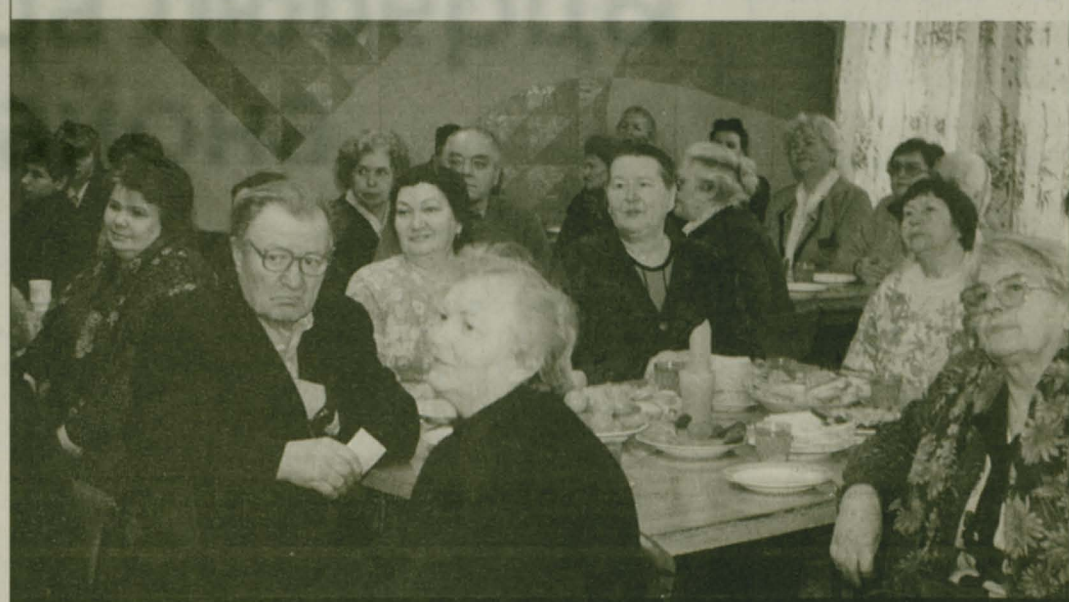
Каждый человек имеет право на уважение человеческого достоинства. Поэтому он и должен его получать. И это не просто подталкивание к жизни, а помощь в том, чтобы человек смог реализовать свои способности и таланты.