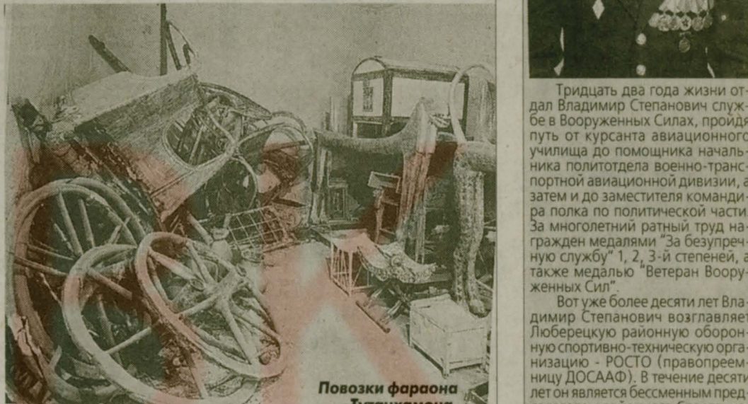
Повозки фараона Тутанхамона.

Ты только прислушайся к этим словам: "долина фараонов", "долина царей" - богатые, помпезные кладбища древних правителей египетской цивилизации, которой 5 тысяч лет. В Каирском национальном музее нам показали сокровища Тутанхамона, те, что привезли в Москву. Эти пирамиды мы ехали по Каиру. Большой восточный город, где башни мечетей соседствуют с современными зданиями и водителя на дороге ездит по своим только им ведомым правилам ("Светофоры у нас для самолетов", - шутил экскурсовод).