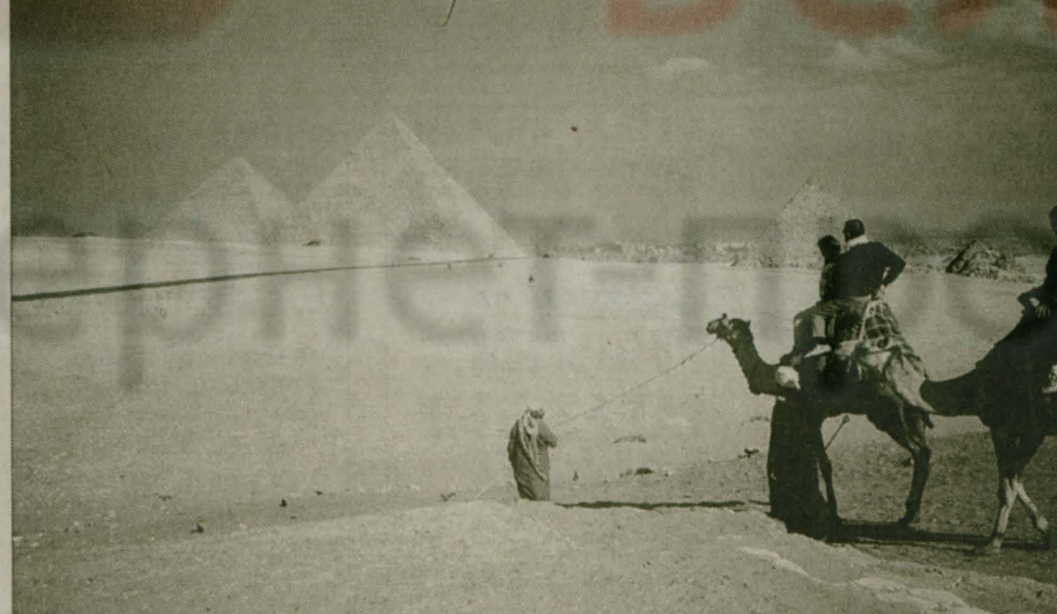
На подступах к пирамидам.