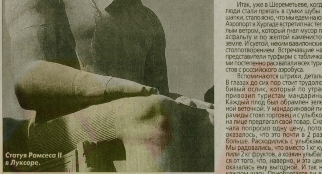
Статуя Рамсеса II в Луксоре.

Итак, уже в Шереметьево, когда люди стали прятать в сумки шубы и шапки, стало ясно, что мы едем на юг. Аэропорт в Хургаде встретил нас теплым ветром, который гнал мусор по асфальту и по желтой каменистой земле. И суетой, неким вавилонским столпотворением. Встречавшие нас представители турфирм с табличками постепенно расхватали всех туристов с российского аэробуса.