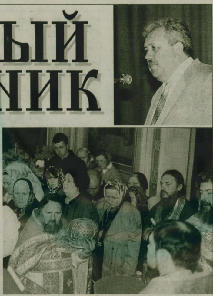
Стекло часовни куплено в Москве. Крест воздвигли, добротные двери из липы привезли из Ярославля...