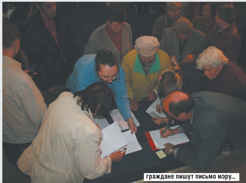
граждане пишут письмо мэру...

Материалы полосы подготовил Сергей ПРИЩЕПОВ