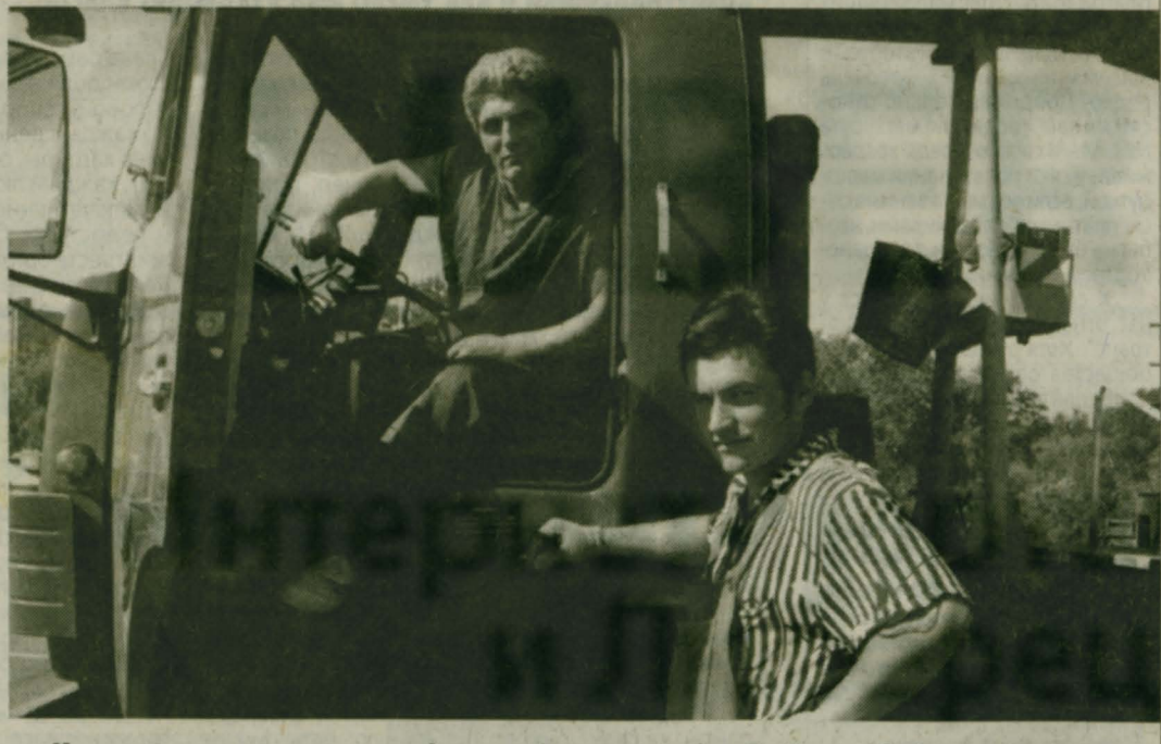
На снимках: в эти июльские дни погода благоприятствует дорожным работам на эстакаде в Люберцах. Водителей просят потерпеть. Пробки - явление временное.

Работы на путепроводе планируются завершить к середине августа. Можно надеяться, что с их окончанием будет полностью исключены дорожно-транспортные происшествия на этом участке автотрассы.