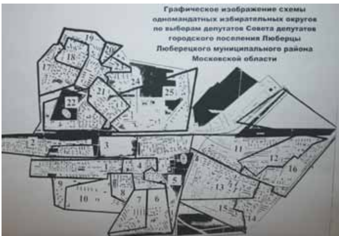
Графическое изображение схемы одномандатных избирательных округов по выборам депутатов Совета депутатов городского поселения Люберцы Люберецкого муниципального района Московской области