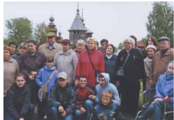
Люберецкое районное общество детей-инвалидов и инвалидов детства «Преодоление» во время экскурсии по святым местам Подмосковья.