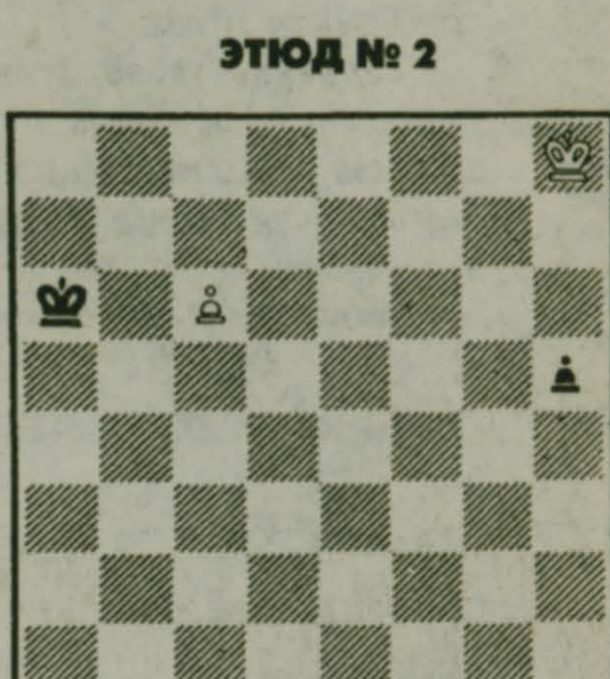
ЭТЮД № 2

Рассуждая о пространстве шахматной доски, правомерно говорить не столько о геометрии, сколько категориями высшей математики - такими как "метрическое пространство" или "топология".