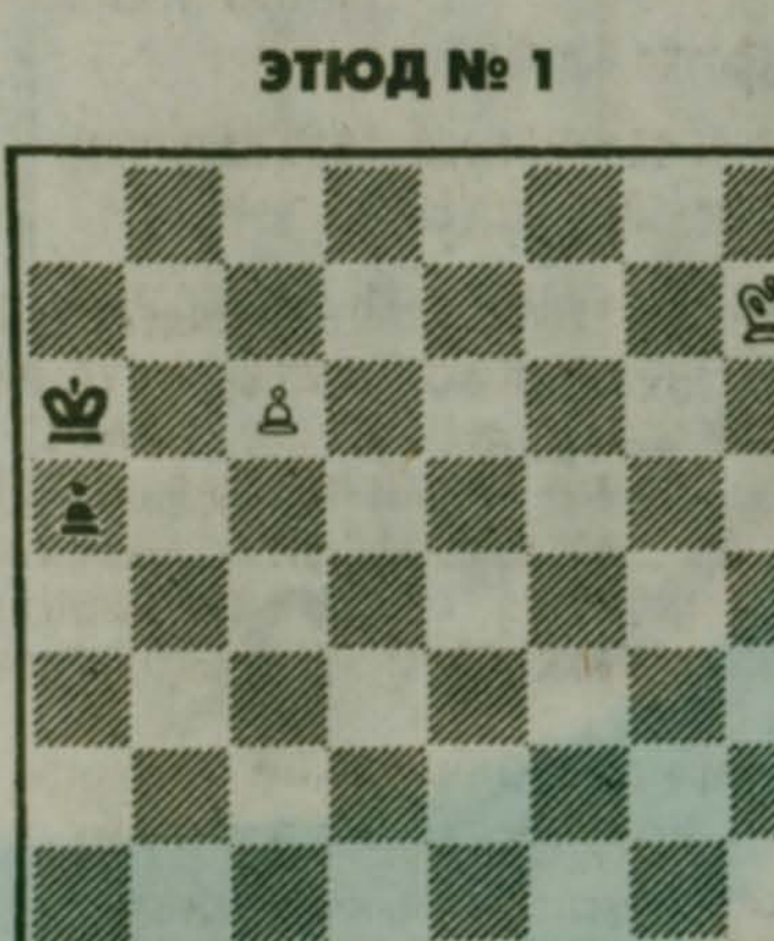
ЭТЮД № 1

Рассуждая о пространстве шахматной доски, правомерно говорить не столько о геометрии, сколько категориями высшей математики - такими как "метрическое пространство" или "топология".