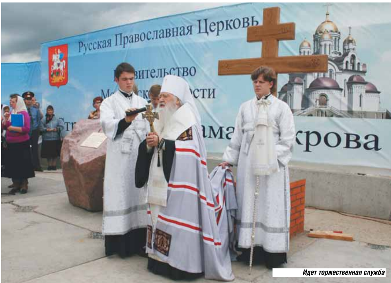
Идет торжественная служба