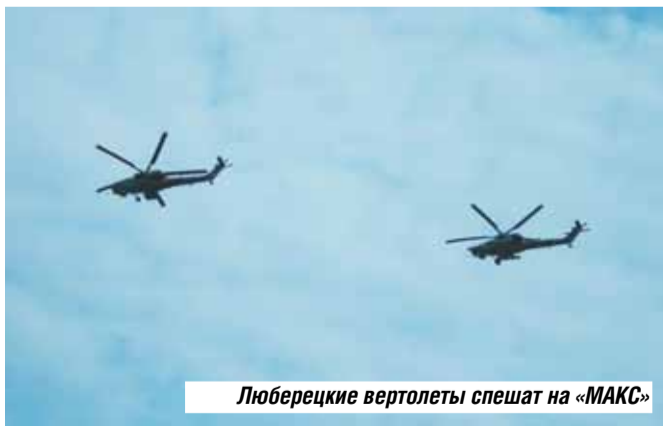
Люберецкие вертолеты спешат на «МАКС»

Проезд для «пеших» посетителей – электропоездами с эмбле-