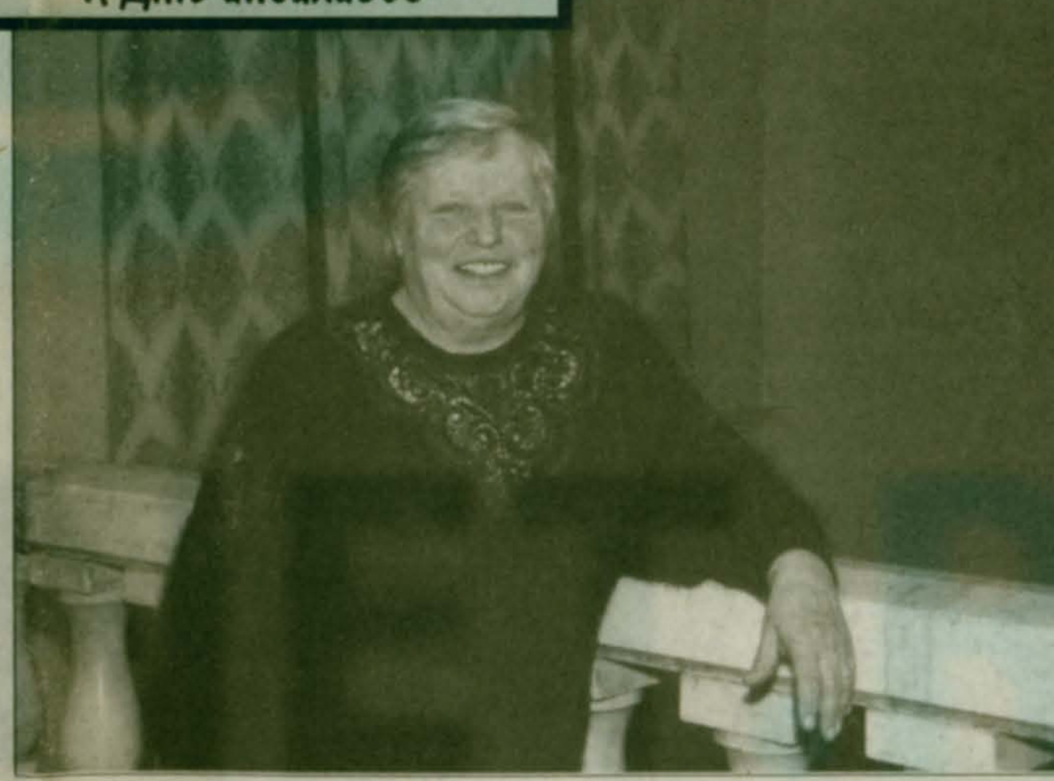
5 ДЕКАБРЯ В ЛЮБЕРЕЦКОМ ДВОРЦЕ КУЛЬТУРЫ СОСТОИТСЯ КОНЦЕРТ, ОРГАНИЗОВАННЫЙ РАЙОННОЙ АДМИНИСТРАЦИЕЙ И КОМИТЕТОМ ПО СОЦИАЛЬНОЙ ЗАЩИТЕ, ПОСВЯЩЕННЫЙ МЕЖДУНАРОДНОМУ ДНЮ ИНВАЛИДОВ. СО ВСЕХ УГОЛКОВ РАЙОНА СЮДА ПРИБУДУТ ТЕ, КМУ ПРИХОДИТСЯ ОСОБЕННО ТЯЖКО В НАШЕ И БЕЗ ТОГО НЕПРОСТОЕ ВРЕМЯ...

Но вот что поразительно и символично: люди эти, на долю которых выпало так много переживаний и невзгод, не замкнулись в собственном горе, не стали пассивными рабами своих болезней, ни бесконечными жалобщиками на несправедливость судьбы. Своим оптимизмом, жизнелюбием и активной гражданской позицией они преподнесли непохожий урок многим из нас - тем, кто, случись малейшая неудача, впадает в уныние и "ждет у моря погоды".