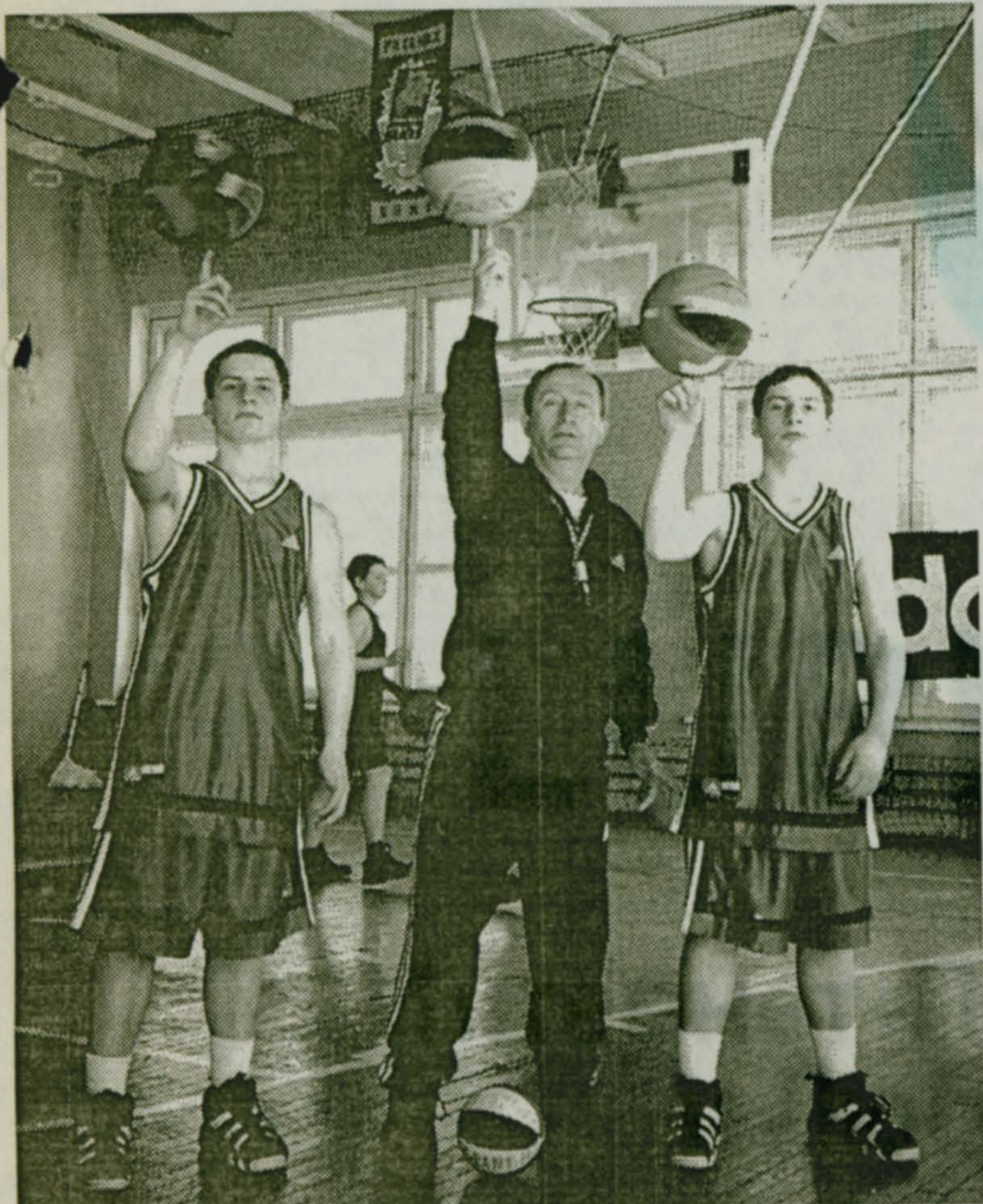
Незабываемое шоу семьи Рзаевых на открытии турнира.

P.S. По чисто техническим причинам не все фотоматериалы о закрытии турнира попали в этот номер газеты. Опубликуем их в следующих номерах.