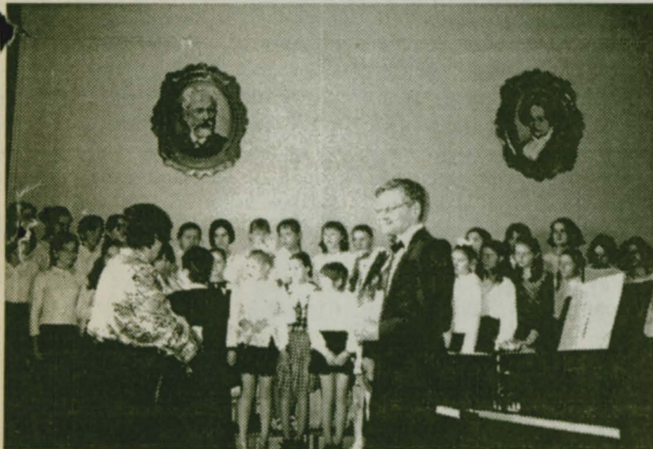
Поздравления с юбилеем от администрации поселка...