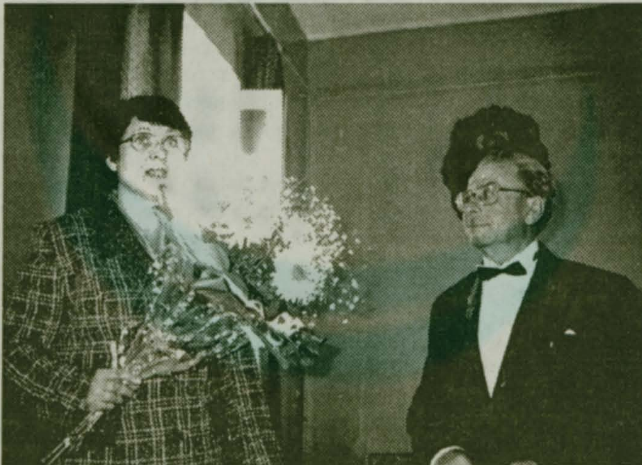
...и от Люберецкого комитета по культуре