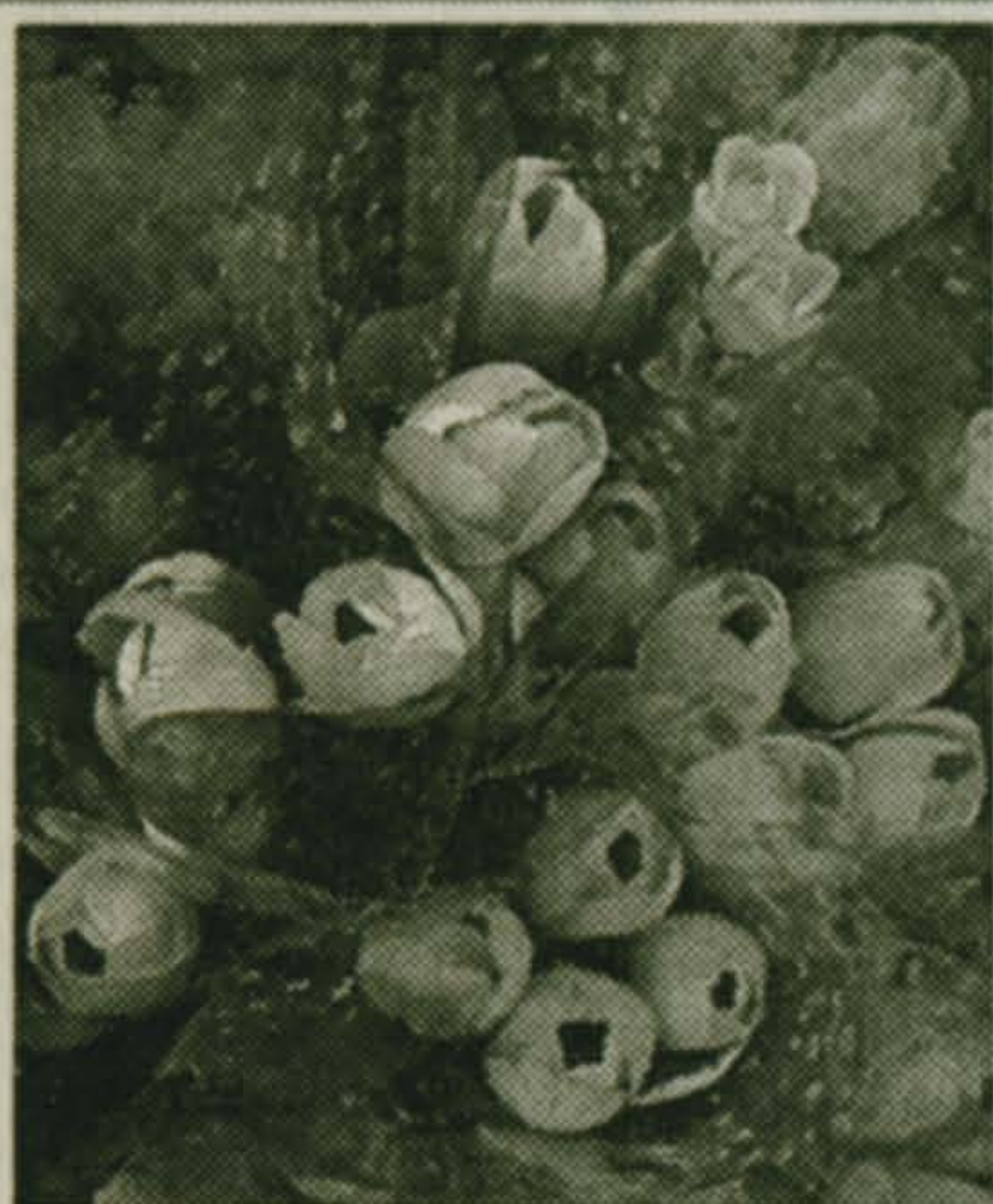
с 5 по 11 мая

Средние даты некоторых сезонных явлений мая.