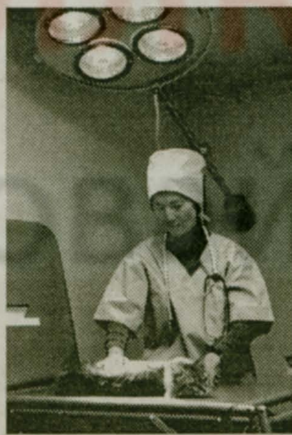
С 6 мая в поселке открылся ветеринарный кабинет.

Наконец, пробел в обеспечении жителей поселка данным видом услуг заполнен. Следует отметить удобное местонахождение веткабинета: в самом центре Малаховки, в 50 метрах от входа в рынок, в строении, расположенном напротив здания "Правопорядка".