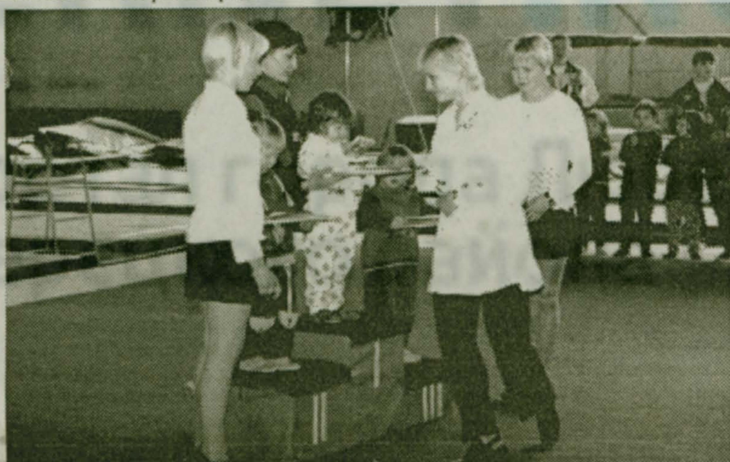
Первые спортивные призы - самые вкусные