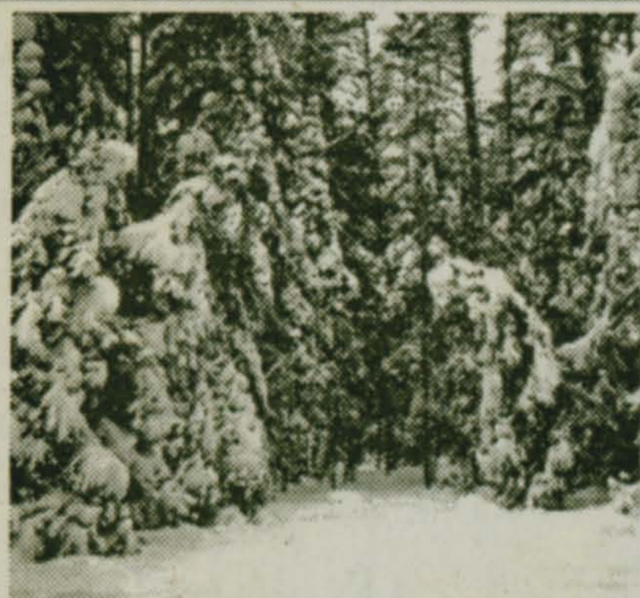
С 19 по 25 января

21 января солнце вступает в знак Водолея, знак Воздуха под покровительством Сатурна и Урана. По календарю счастливых цветов январю соответствует гвоздика. Счастливыми камнями считаются гранат и розовый кварц.