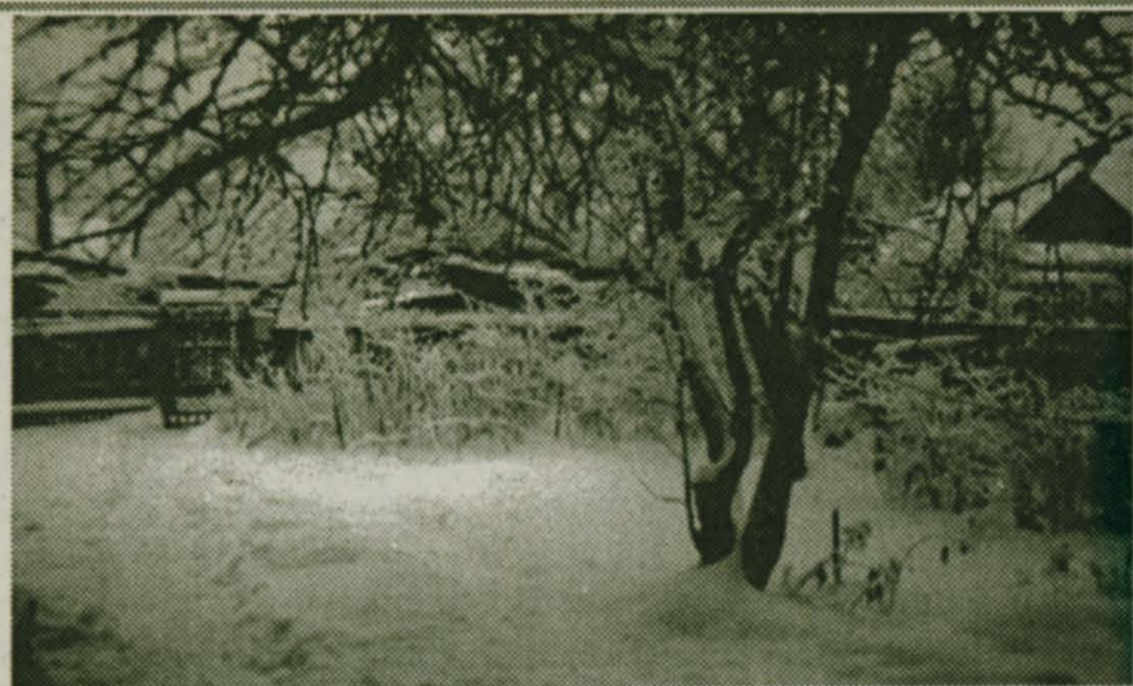
с 1 по 8 февраля

Под голубыми небесами Великолепными коврами, Блестя на солнце, снег лежит... А.С. ПУШКИН